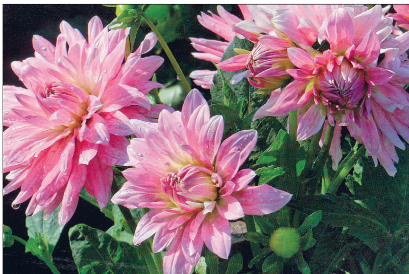
Dekoratiivdaalia 'Alexander von Humboldt'.

tele, taluvad nad hästi ka pikki vihmaperioode. Vastupidav on veel 100 cm kõrgune roosaõieline 'Alexander von Humboldt'. Kes eelistab tumedaid sorte, peaks valida mustjasroheline lehestiku ja tumepunaste õitega sordi 'Fire Mountain'.