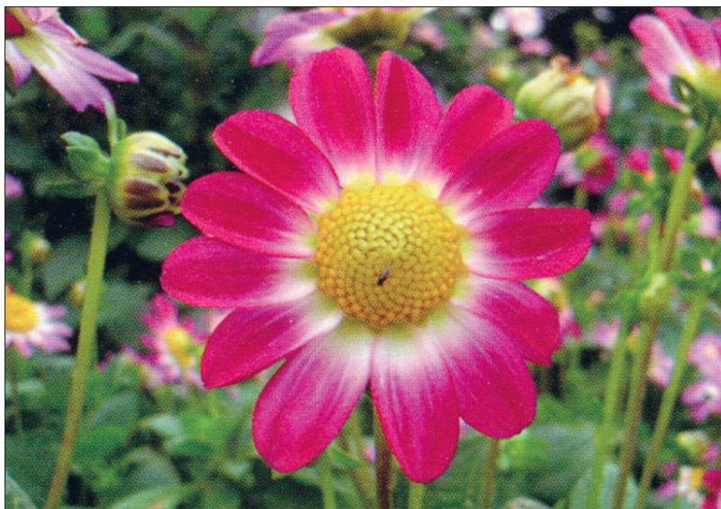
Lihtõieline daalia 'Sweetheart'.