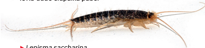
► Lepisma saccharina

pakendite, mööbli või muu- de asjadega. Ta ei armas- ta valgust, tegutseb häma- ras. Majasoomukad maius- tavad suhkrut, jahu ja tärkli- sega, jahukliistri abil kleebi- tud tapeediga, neid on leitud tärgeldatud pluusikraedelt ja kätistelt, kingapaeltelt, karusnahkadelt, vaipadelt. Nende tegevuse tagajärje- na võib näha auklikuks näri- tud tapeeti.