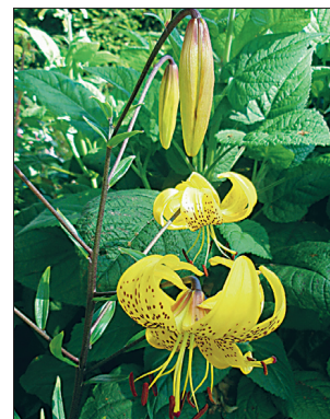
Tiigerliilia suurte erekollaste õitega sort 'Citronella'.