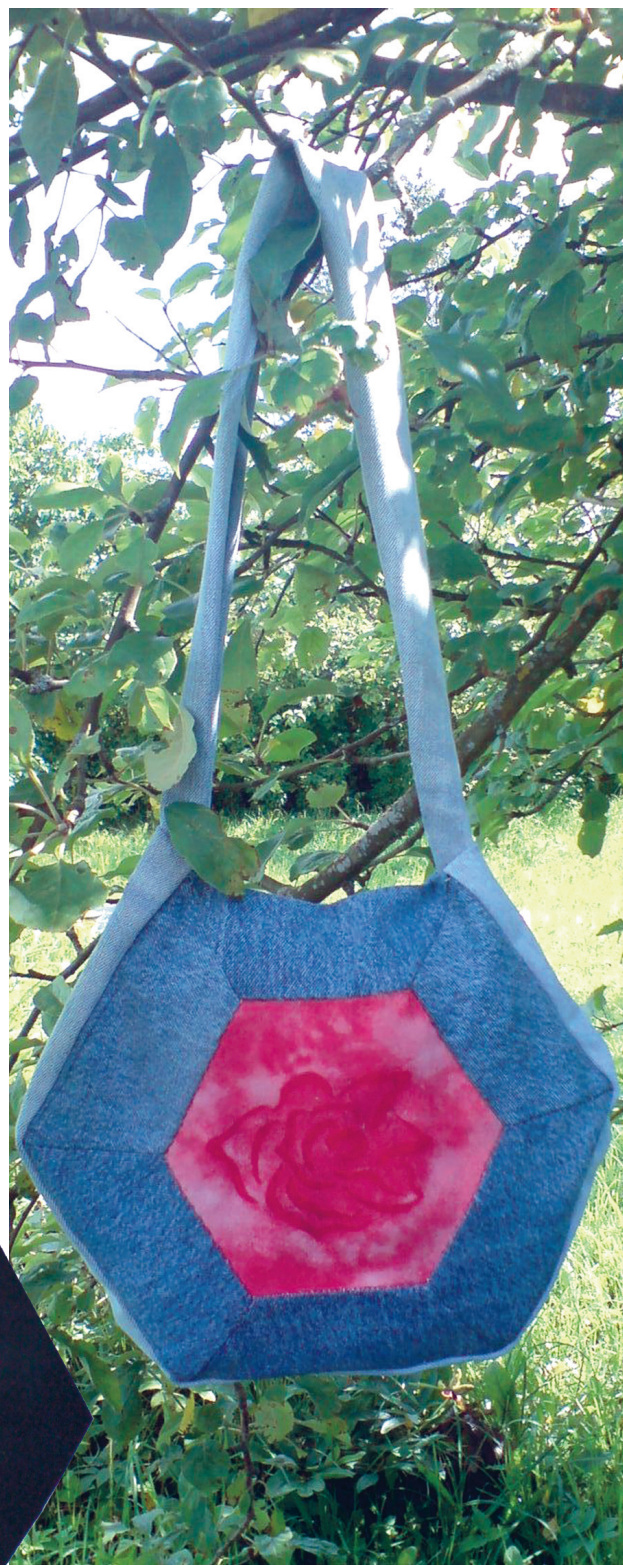
Kuusnurkne teksakott päikese abil printitud roosiga.