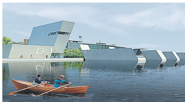
“LANDMARKI” võistlustöö.

Võistluse korraldasid SA Uue Kunsti Muuseum koostöös Eesti Arhitektide Liidu ja Pärnu linnavalitsusega. Peapremiat summas 5000 eurot rahastab Eesti Kultuurkapital.