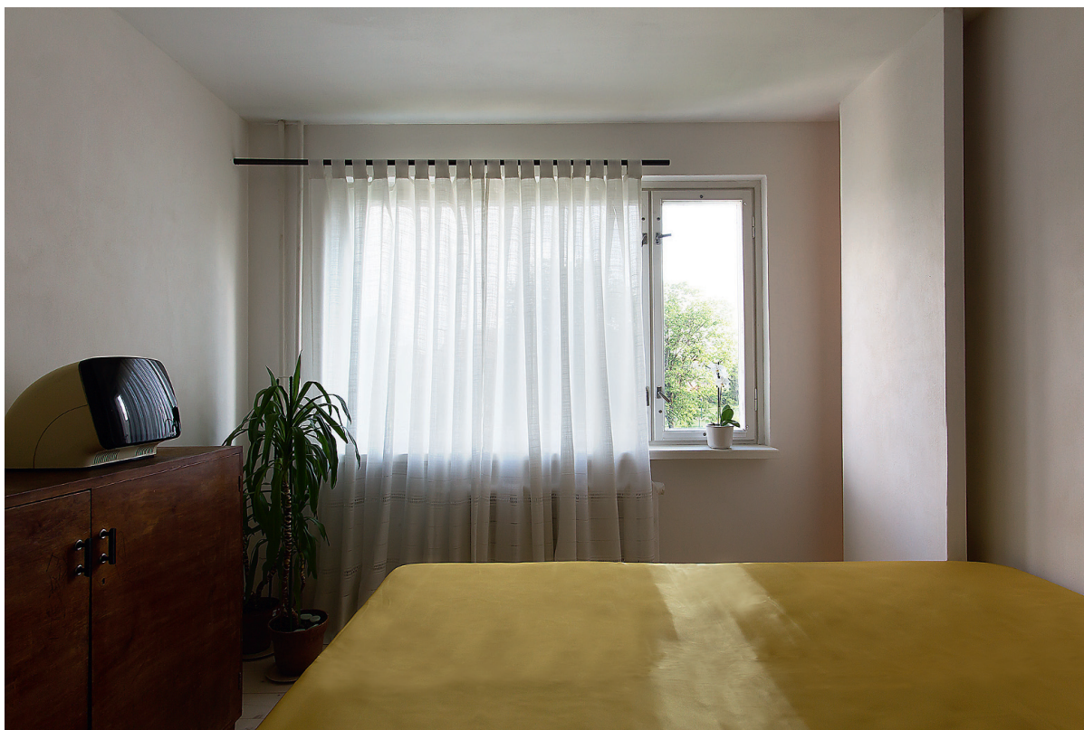
Tühjaks lammutatud ruumi asetati tagasi vähim võimalik, seina lisati aga naabrite müra summutav paneel.