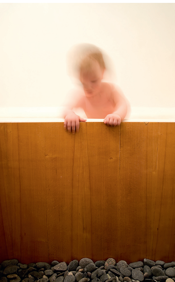
Suures toas asunud vana seksioonkapp leidis uue elu vannitoas.