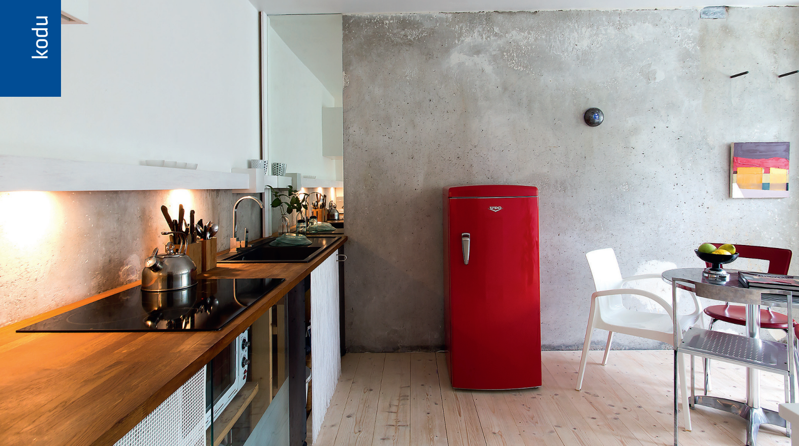
Elutuba sai uue ilme ja hingamise, sinna tehti avatud köök.