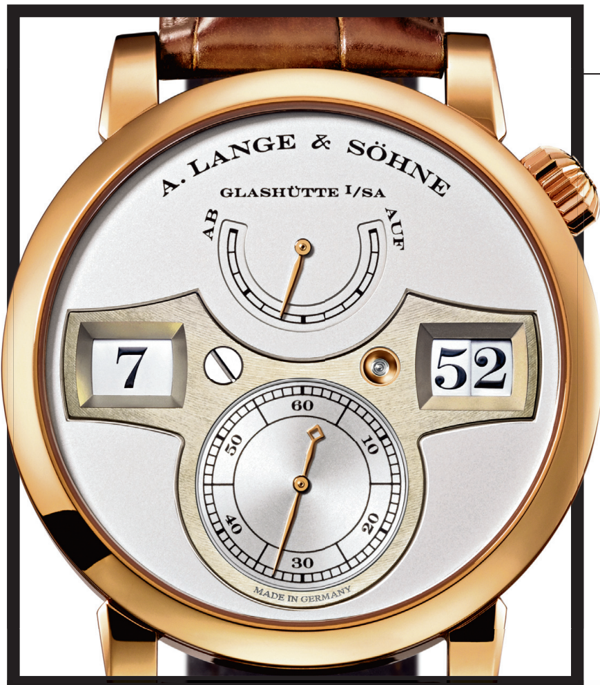
VEDRUGA TUNNID – A. Lange & Söhne on esimene mehaaniline kell hüppavate numbritega.

☑ Tegu on tõelise traditsioonide pärandiga, mis on tehtud võimust, elegantsist ja detailidele pööratud tähelepanuga. 1350-kilogrammiline auto on oma klassi kergeim ning 730 hobujõu ja AMG mootoriga ka üks võimsaimatest autodest. Huayra on teistest konkurentidest peajagu üle ka hoole poolest, mis on pandud süsinikkiust ja titaaniumist kere valmistamisele. Ohutuse eest vastutavad ballistilised materjalid, mida kasutatakse tavaliselt tankide valmistamiseks ning üdini nahast ja alumiiniumist sisemus tekitab aukartust ka kõige peenemates huvilistes.