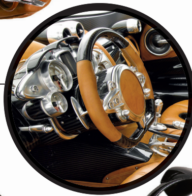
ULTRAKERGE KIIRUS – Võimas Huayra kaalub kõigest 1350 kilogrammi.

Nii sõiduteel kui ka randmel on tähtis voolujoonelisus. Detailidele pööratud tähelepanu näitab ootamatult palju kvaliteeti.