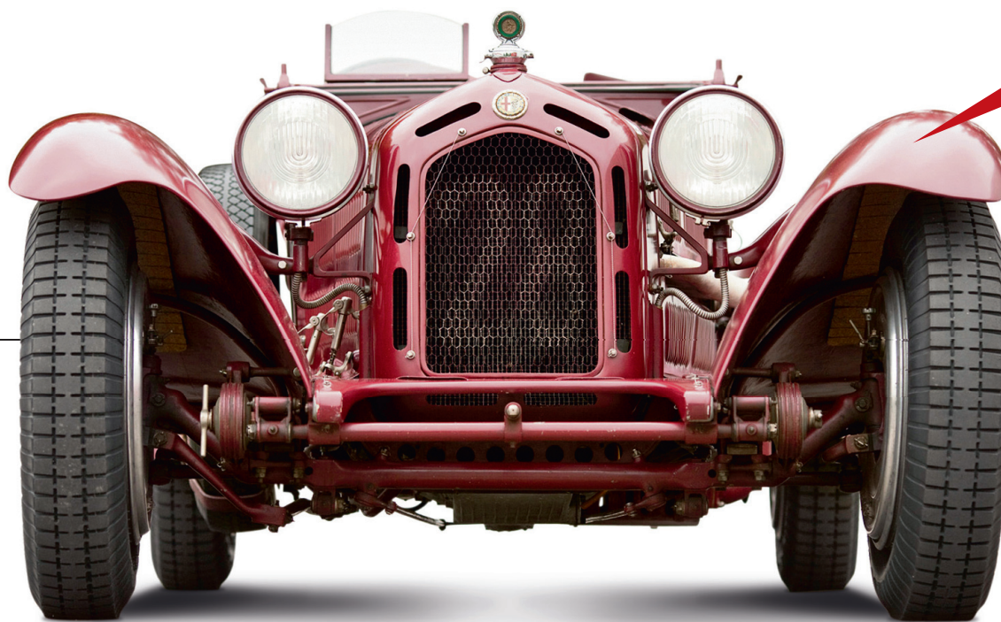
ALFA ROMEO C2300 MONZA 1931

Alates 1931. aastast on olnud vähemalt kümme autot, mis on oma nimes avaldanud austust sellele paigale, mis kätkeb endas suurt osa neljarattaliste ajaloost. Monzat on nimetustes kasutanud nii rekordipurustajad Alfa Romeo , Ferrari kui ka Mercedes , kuid on ka neid, mis seda kiirusetemplit pigem distantsilt kummardavad.