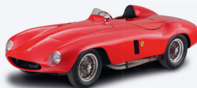
FERRARI 250 MONZA SPIDER 1954