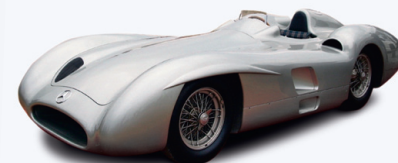
MERCEDES W196 TYP MONZA 1954