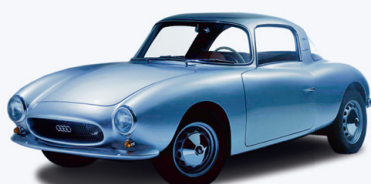
AUTO UNION DKW MONZA 1956

ühe Corvair' mudeli, mille nimeks sai Monza Club. Mudelil pole spordiga küll mingi pistmist, ent samal aastal ilmus New Yorgi auto-