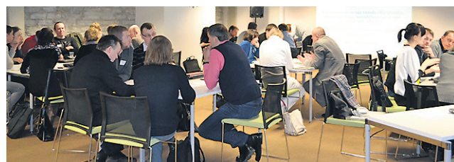
ARHITEKTUURI Trampliin jätkab sügisel.

Palkmajaehitajate kutsevõistluse toimumisele aitasid kaasa Eesti Puitmajaliidu koostööpartnerid RMK, Räpina vald ning Väraska Sanatoorium ja Veekeskus.