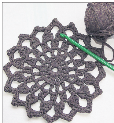
Vaiba heegeldamisel võib ette võtta mõne lihtsama hegelliniku mustrit ning vaiba selle järgi valmis teha. Tulemus on tavapärasest erinev ning kindlasti pilkupüüdev.