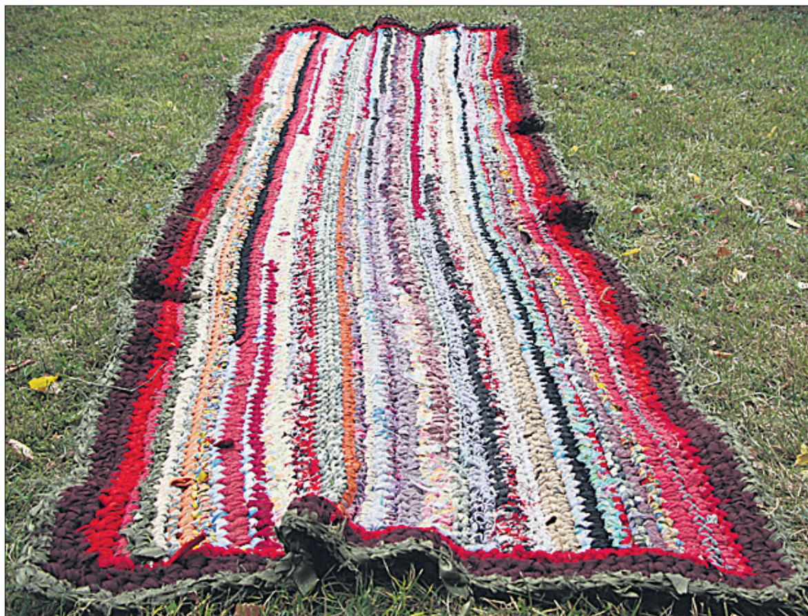
Vaip on heegeldatud kinnissilmustega, kasutades eri materjale ning ka toone. Värvikirevust aitavad leevendada üle heegeldatud servad.