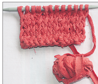
Kes eelistab kudumist, võib vaiba hoopis kududa. Esmalt väiksemad pikad ribad ning hiljem need kokku heegeldada või õmmelda. Nii on võimalik teha suurt vaipa, sest väiksemaid ribasid ei ole nii raske kudumise ajal käes hoida kui ühes tükis tehtud vaipa.