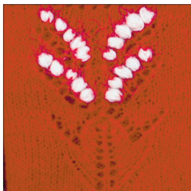
Kätised paremalt poolt.

nupp (koo ühest simusest välja 7 silmust – parempoolne silmus, õhksilmus, parempidine silmus jne). Parempidisel real kasvata-tud nupp kududa pahempidisel real pahempidi kokku.