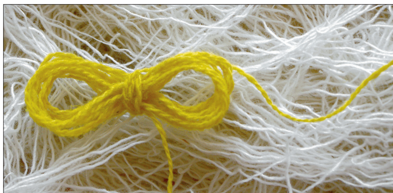
Valmis käblik. Lõng hakkab jooksuma sellest otsast, mis alustamisel peopessa jäi.