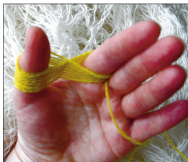
Käbliku tegemiseks kerige lõng nimetissõrme ja pöidla vahel kaheksasse. Võtke käblik sõrmede vahelt ära ning kerige paar tiiru veel keskosa ümber.