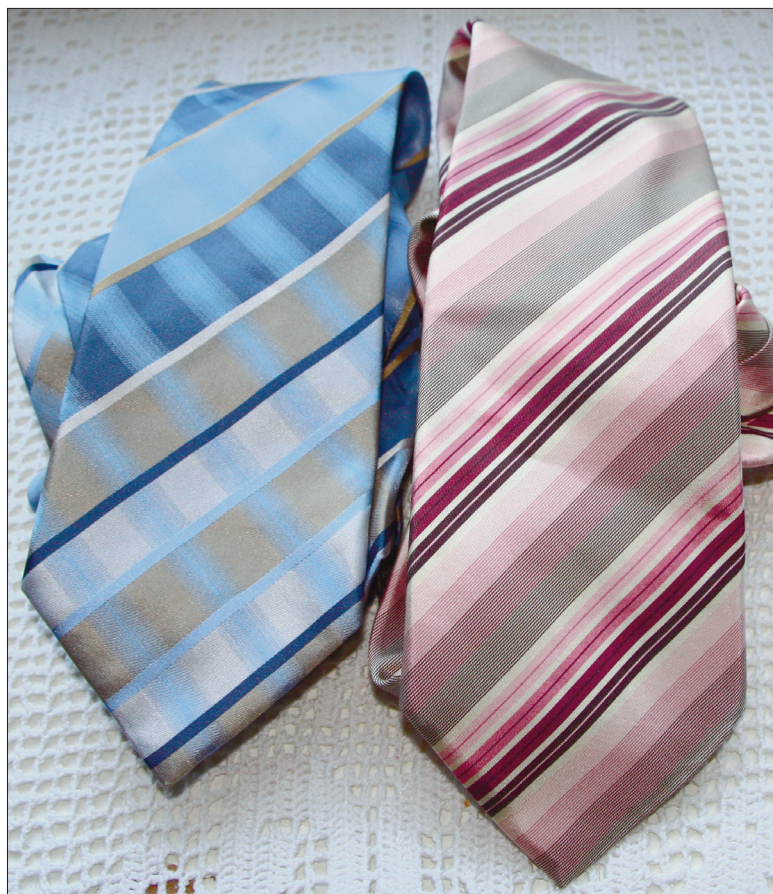
Esmalt katsetasin munade värvimist roosa ning sinise lipsuga, mõlemad andsid õrnad toonid.