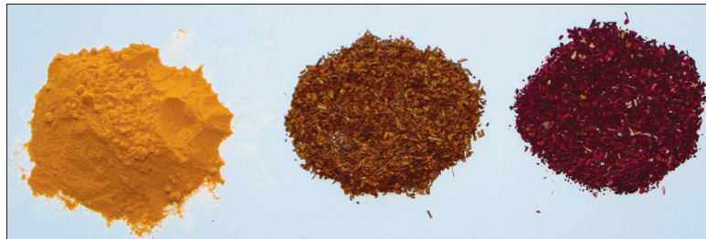
Eksperimendis osalesid (vasakult) kollajuur, rooibos, hibisk.

Lihavõtete lähenedes jääb nii mõnigi sibul, kes on suutnud talve edukalt üle elada, hulga väiksema koorekihi alla. Sibulakoortega värvimine on klassika, milles ei pea pettuma.