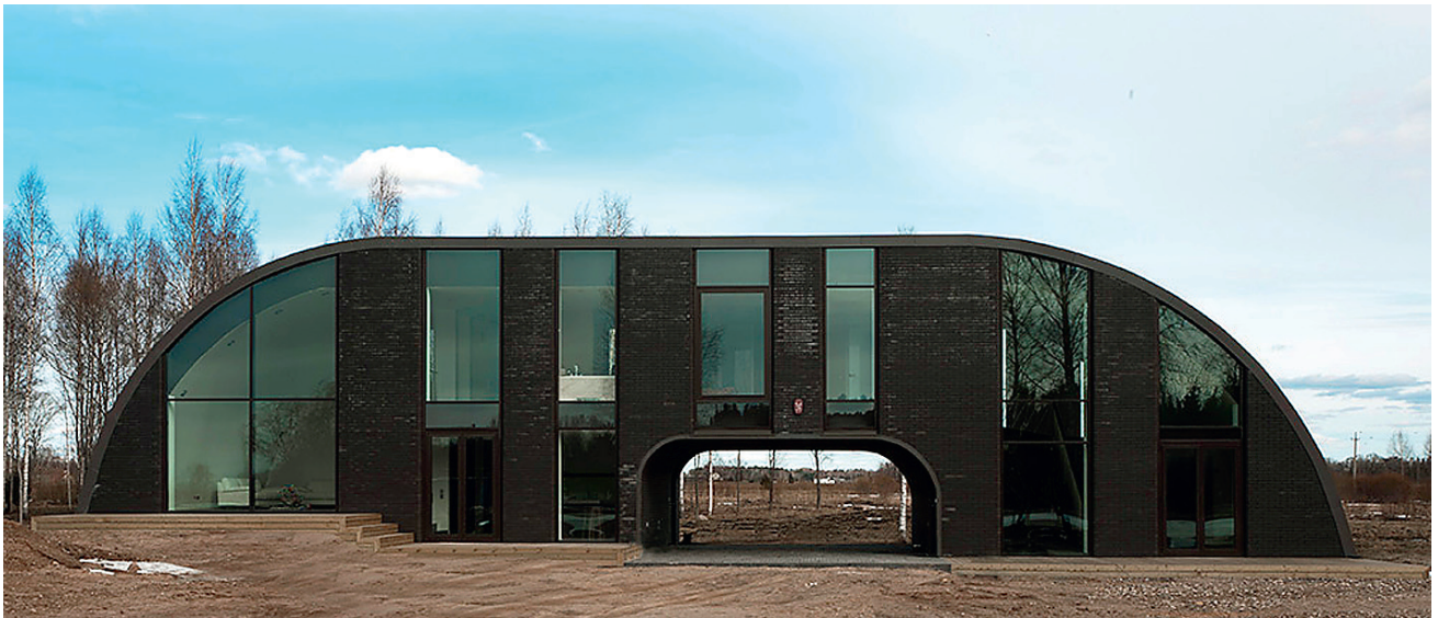
ANTSLAS asuv telliseramu – isiklik pelgupaik, mida tuntakse ka kindluse nimetuse all.