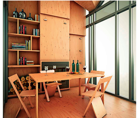
PISIMAJA Bunkie nõuab paigaldamiseks 10 ruutmeetrit.