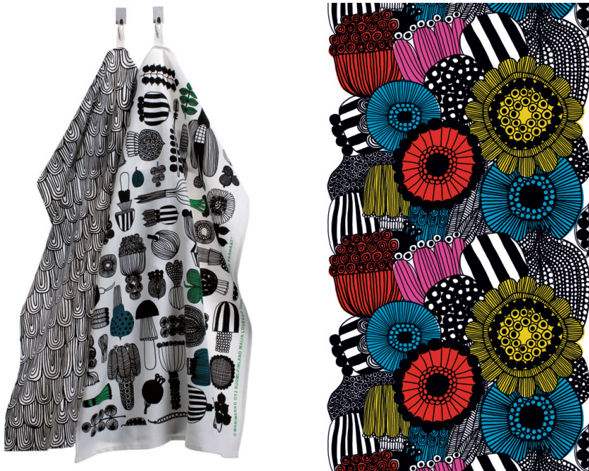
Uued ja huvitavad mustrid Marimekko tänavusest kolleksioonist.