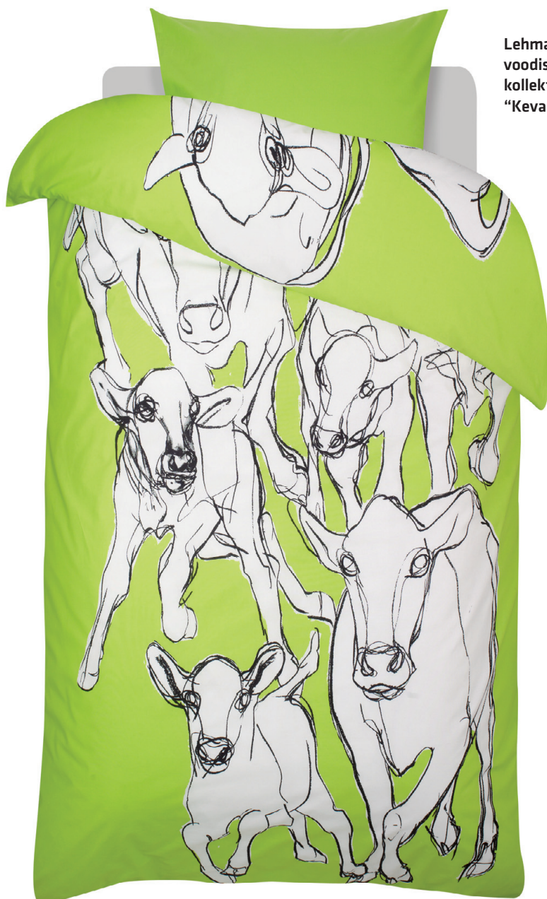
Lehmad voodis – kolleksioon “Kevadpidu”.

mitte näiteks Hiinas. See ajab hinna muidugi kõrgemaks, aga ilmselt on just see üks põhjustest, miks soomlased Marimekkot nii kangesti armastavad – seal saavad tööd Soome disainerid, kelle väljamõeldu tehakse suuresti valmis Soomes, mitte näiteks Indias või Hiinas. Niikko sõnul on mõnus, et disainerid ja tootmine asuvad samas majas. Nii saab kunstnik ise kõigis tootmisprotsessi osades aktiivselt kaasa lüüa.