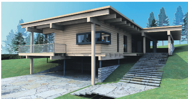
ARVUTIS loodud visioon Lohusalu majast hakkab üha enam sarnanema valmiva hoonega.