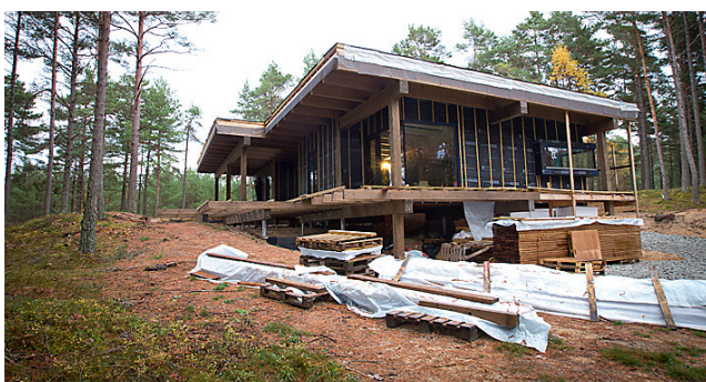
LOHUSALU maja välisvaade 23. oktoobril 2012.

salt sellepärast, et keegi läks duši all. Või veelgi kehvem – keegi avab kuskil mujal kraani ja saad duši all ootamatult kaela sortsu jahedat. Boonusena võib vajaduse korral iga toru eraldi sulgeda.