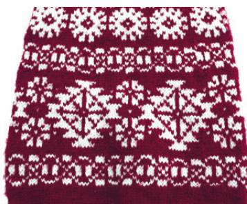
Kaheksakand ja kiil.

Boa on kootud ringselt, varrastega number 3, alustuseks loodud 152 silmust, 25 rida soonikut, seejärel 15 rida parempidi, ning ongi kindakirjade kudumise aeg.