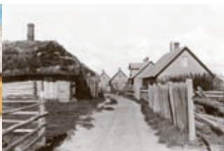
Peipsi-äärne külatänav (1923)

Vene vanausuliste kogukond tavatseb elada pikkades tänavkülades, mis võivad olla mitu kilomeetrit pikad. Majad paiknevad ainsa tänava ääres ja on omapärase arhitektuuriga – ühe katuse all on elu- ja abiruumid ning laut. Igas majas on ikoon ja õuel labidas. Järv annab külarahvale kala ning peenramaa sibulat ja juurvilja. Suvine vaatamisväärsus on pikad ja sirged käsitsi kaevatud sibulapeenrad, sügisel suured sibulakuhjad.