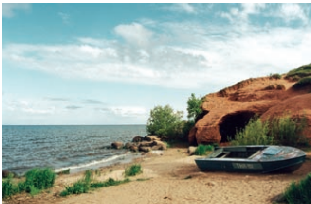
Peipsi rand Kallastel (2001)

Oma suurusega mõjutab järv mõistagi märgatavalt kohalikku kliimat. Sügisel püsivad ilmad keskmisest kauem soojad, kevad seevastu saabub kuni kaks nädalat hiljem. Peipsit peetakse üheks Euroopa parimaks kalajärveks, sest siin elab 37 liiki kalu, seega on siin esindatud enam kui pool Eesti kalaliikidest. Samuti on järv linnurikas: tema veepeeglil ja järve lähiümbruses on ühtekokku täheldatud 232 liiki linde, neist 175 ka pesitsevad siin.