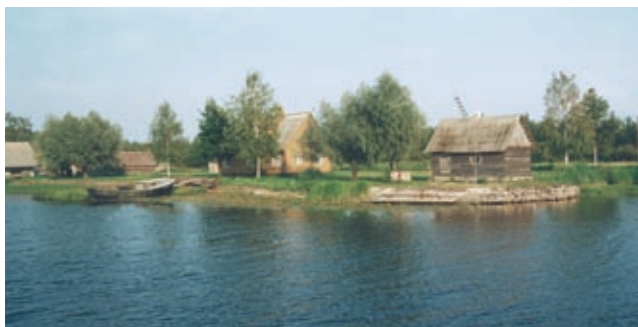
Praaga küla Emajõe suudmes (2002)

Praaga on omapärane asula, kuhu pääseb vaid mööda veeteed. Sagedaste veetõusude tõttu on hooned rajatud vaiadele ning majapidamisi ühendavad postidele toetuvad laudteed.