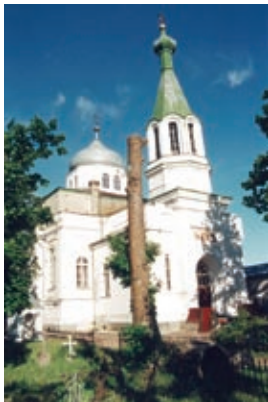
Prohvet Eelija õigeusu kirik ja klooster (2002)

Juba 14. sajandil oli see paik tuntud kalapüügikohana. Siinsetele venelastele oli kalapüük sageli ainus sissetulekuallikas, millele vaid vähesel määral andsid lisa käsitöö ja kaubitsemine. Eestlased tegelesid ka maaviljelusega.