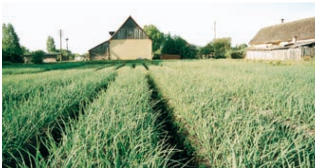
Sibulapeenrad Varnja külas (2002)