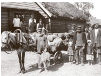
Siguri kokkuostja (1923)

Looduslikud eeldused maaviljeluseks pole kõikjal ühesugused. Kõige vähem sobivad põllumaadeks soised Želtša ja Tšornaja jõgikond, laialdased alad Oudova (Gdov) rajoonis, Emajõe suudmeala, Alutaguse ja Palumaa. Viljakamatel aladel Peipsi lõuna- ja lääneosas elatuvad