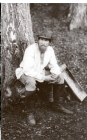
Setud 20 sajandi algul