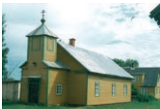
Kirik Piirissaarel (2001)

teisest Suurjärve ja Lämmijärve ning Eestit ja Venemaad. Kogu saar on maastikukaitseala ning hiilgab oma liigirikkusega, eriti huvipakkuv on see konnade ja lindude rohkuse poolest. Piirissaar on arhailise elulaadiga omapärane etnilis-kultuuriline piirkond, kus elab umbes 100 inimest. Saarel on väike vanausuliste kirik.