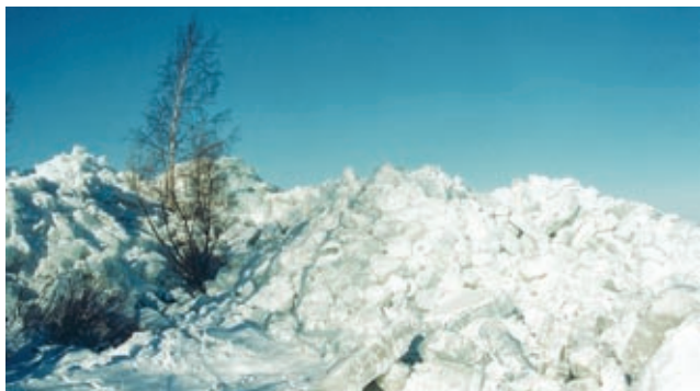
Rüsi jää Nina külas (2002)

Nina tuletorni juures on üks parimaid paiku rändavate merelindude vaatluseks sisemaal. Siin asub tähelepanuväärne klassitsistlikus stiilis Jumalaema Kaitsmise õigeusu kirik.