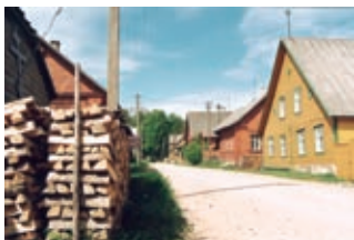
Varnja küla (2002)

1300 peamiselt vene rahvusest elanikuga Kallaste väike-linn paikneb umbes 2 km ulatuses järve läänerannikul kuni 8 m kõrgusel punasest liivakivist kaldajärsakul. Siin asub Peipsi linnutihedaim kaldalõik, kus paarisaja meetri pikkusel liivakivipaljandil pesitseb üle 1000 kaldapääsukese. See on Eesti üks suurimaid kaldapääsukeste kolooniaid. Varem on siin pesitsenud isegi üle 2000 pääsukesepaari.