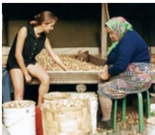
Sibulate sorteerimine (2001)

miseks. Peipsil käib tööle üle 1200 kutselise kaluri, kellele lisandub veel paar tuhat Peipsi-äärset elanikku ja suur hulk harrastuskalastajaid.