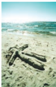
Kauksi rand (2002)