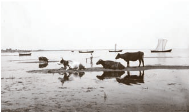
Kasepää rand (1923)

inimesed peamiselt karjandusest. Laialt on levinud kartulikasvatus ning Mustvee ja Kulje ümbruses köögiviljakasvatus.