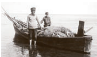
Kalurid Mustvee lähistel (1923)