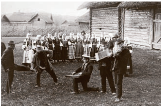
Setud (20 saj. algul)

Peipsi oli asustatud juba keskmisel kiviajal. Peamiselt kalastusel põhinenud elulaad on sajandite jooksul välja kujundanud väga omapärsed subkultuurid. Järve läänekaldal elavad põliselt eestlased, vene vanausulised, vene õigeusklikud ja setud.