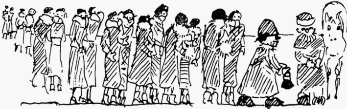
Oli siiski üks voorimees . . .

Leige tee ajas kuuma vere keema ja ainukesest soojast voodist ainsa keskküttetoru kõrval ja riidevarna taga tuulevarjus