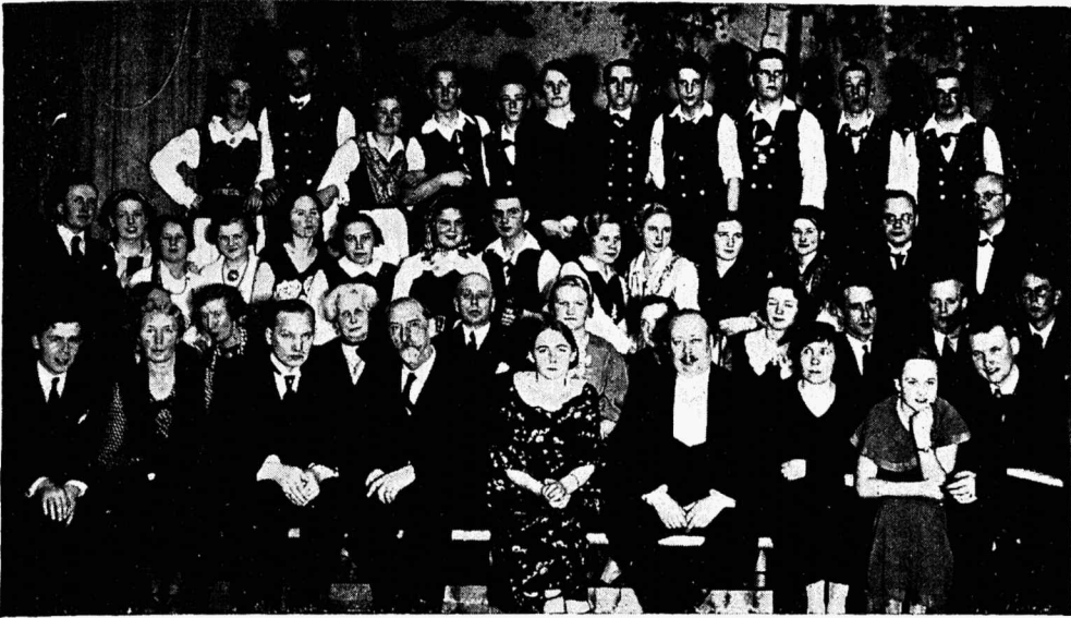
Rootsi-eesti õhtu tegelasi ja osavõtjaid.

matsioonid olid nii rootsi- kui eestikeelsed. Suure aplausi osaliseks sai hr. Brückner'i viiuliettekanne. Lõppakordina järgnesid rahvatantsud: enne rootsi, siis eesti.