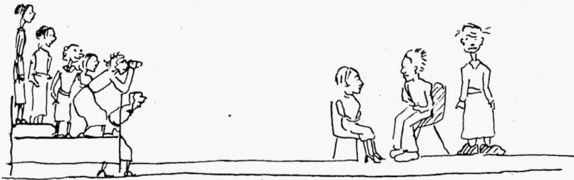
Marile tuli külaline.

kostsid mässulised laulud. Äkki kustutas mingisugune kondine käsi tule ja keegi karjatas „umbluu“. Oli otsustatud, et kuna hommikul kella 7—8 paiku pidime saama vaba aja ja väljas oli ka juba kaunis pimedaks läinud, nagu kunagi kella 7 ümber õhtul, siis pidime tingimata valitsema oma orga-