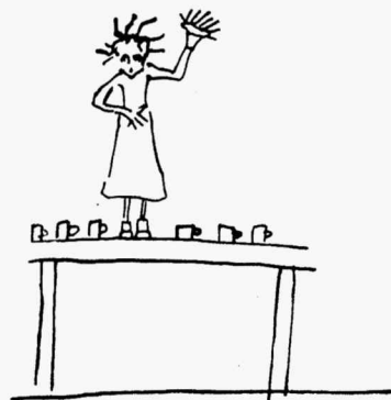
Ets on isegi söögilauas revolutsioonilises meeleolus.

meie palituid. Ses Tallinnas on omapäraselt intelligentsi. Nii seletas meile keegi, kui kaunis oli Faust, kuid meie arvamistes jäi see endiselt Mefistoks. Mõned olid pealinna teatri särast nõnda meelitatud, et sinna jäid veel teisekski etenduseks. Kui teatrist väljusime, võeti meie juures ette rahvaloendus, mis andis üllatavaid tulemusi — neljandal ülelugemisel leiti, et neli õpilast on ülearu. Rõõmuga loobuti edasisest revideeringust ning mindi kohvikute stiilseid väliskülgi uurima.