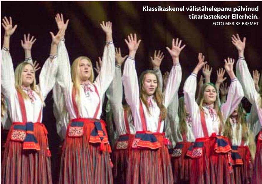
Klassikaskenel välistählepanu pälvlnud tütarlasktekoor Ellerhein.

kitarrist Raoul Björkenheim ning noor fusion -bänd Power Play .