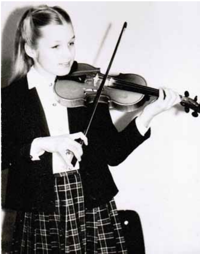
Vändra muusikakooli õpilasena 1980ndatel aastatel.