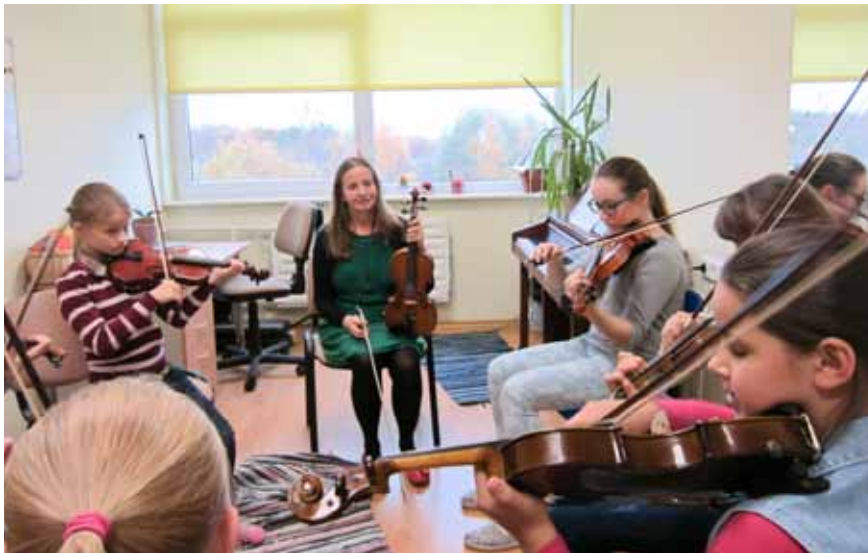
Lasnamäe muusikakooli omaloomingu päev.