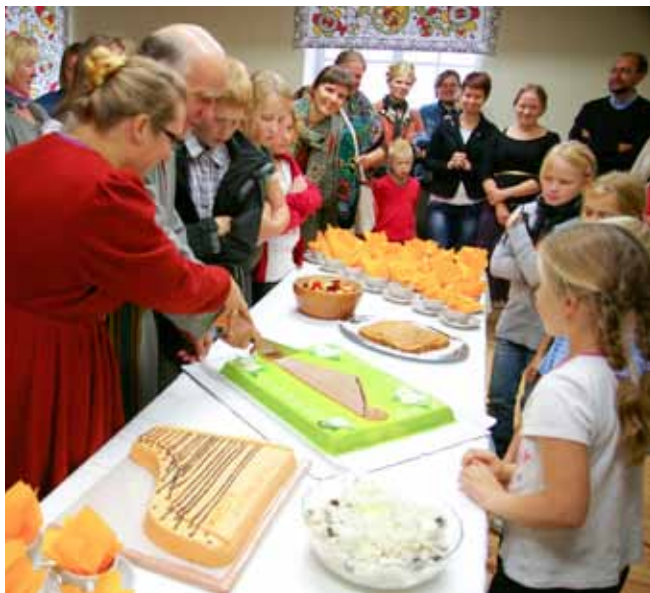
Mooste rahvamuusikakooli avamine 2012. aastal.

Populaarsed pillid peale lõõtsa on veel viiul ja kitarr. Siis on kannel – väikekannel ja erinevad rahvakandle tüübid; mandoliin, plokkflööt – väikestele lastele väga sobiv pill; akordion – imeliselt populaarne keskealiste ja vanemate naiste hulgas. Akordion on minu salaarmastus lapsest saadik, kuna minu isa on mänginud eluaeg akordioni, olnud rahvapillimees, mänginud pulmades ja pidudel. Elu on sundinud mindki seda pilli õppima ja mängima, nii et nüüd ma õpetan seda, ja just omasugustele naistele.