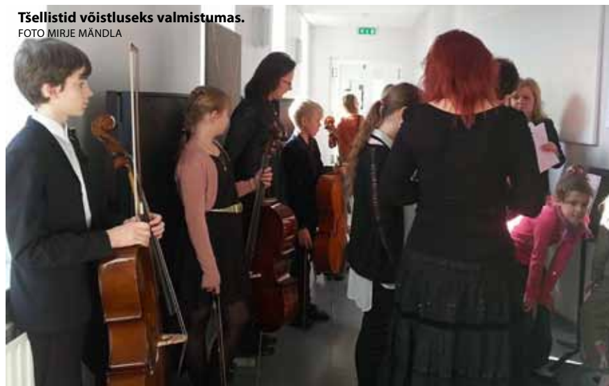
Tšellistid võistluseks valmistumas.