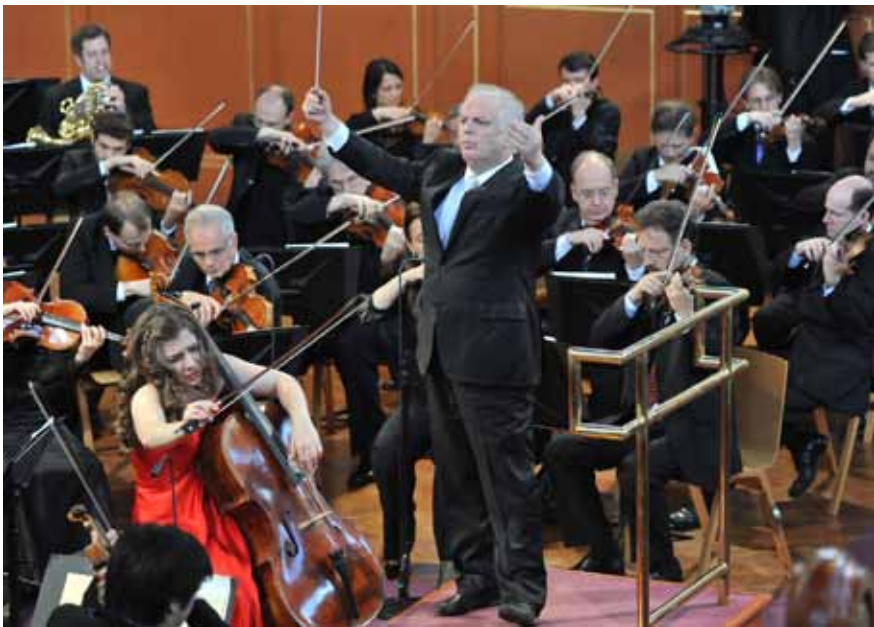
Alisa Weilerstein ja Daniel Barenboim.