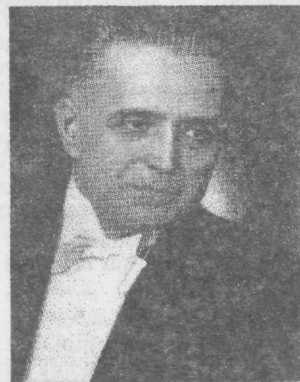
Tartu üliõpilaslaulupeo üldjuhina 1957