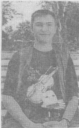
Avo sidelbergi foto.

"Lihtne on areneda, kui on olemas eeskujud. Igast klassist