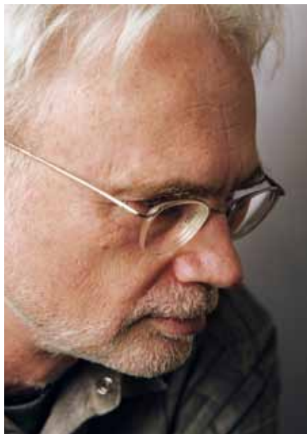
Ooperisalvestuse Grammy võitja John Adams.