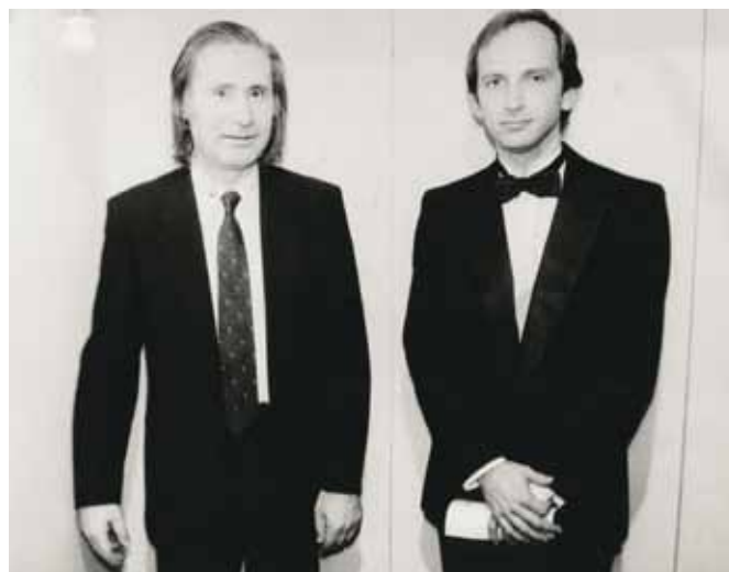
1989. aastal koos Alfred Schnittkega pärast helilooja klaverikontserdi esitust Estonia kontserdisaalis.

Kui rääkida õpilase ja õpetaja suhtest, siis vaatan õpilasi kui