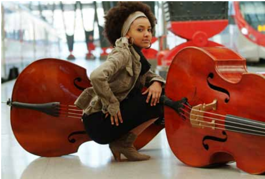
Noor, nägus ja andekas Esperanza Spalding.

rima uue artisti kategoorias, kus jazzmuusikud tavaliselt valituks ei osutu. 2012 töötab tulla vähemasti sama edukas – aprilli keskpaigas alustab Spalding maailmatuuri, mis viib ta Põhja-Ameerika suurtele kontserdilavadele ning toob mai lõpul ka Euroopasse.