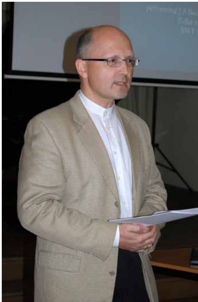
Ettekannet pidamas rahvusvahelisel konverentsil Madeiral 2010. aastal.