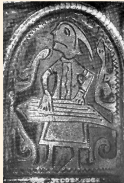
Kiievi Riiklikus Ajaloomuuseumis asuval 12. sajandi hõbekäevõrul mängib mees äratuntavalt viiekeelset kannelt.