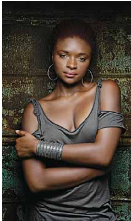
Lauljatar Lizz Wright, üks “Jazzkaare” peaesinejaid.

Euroopa jazz suundumusi ja tipptaset esindavad ansamblid Das Kapital (Saksamaa-Eesti-Prantsusmaa-Taani), Tingvall Trio (Saksamaa), The Flow