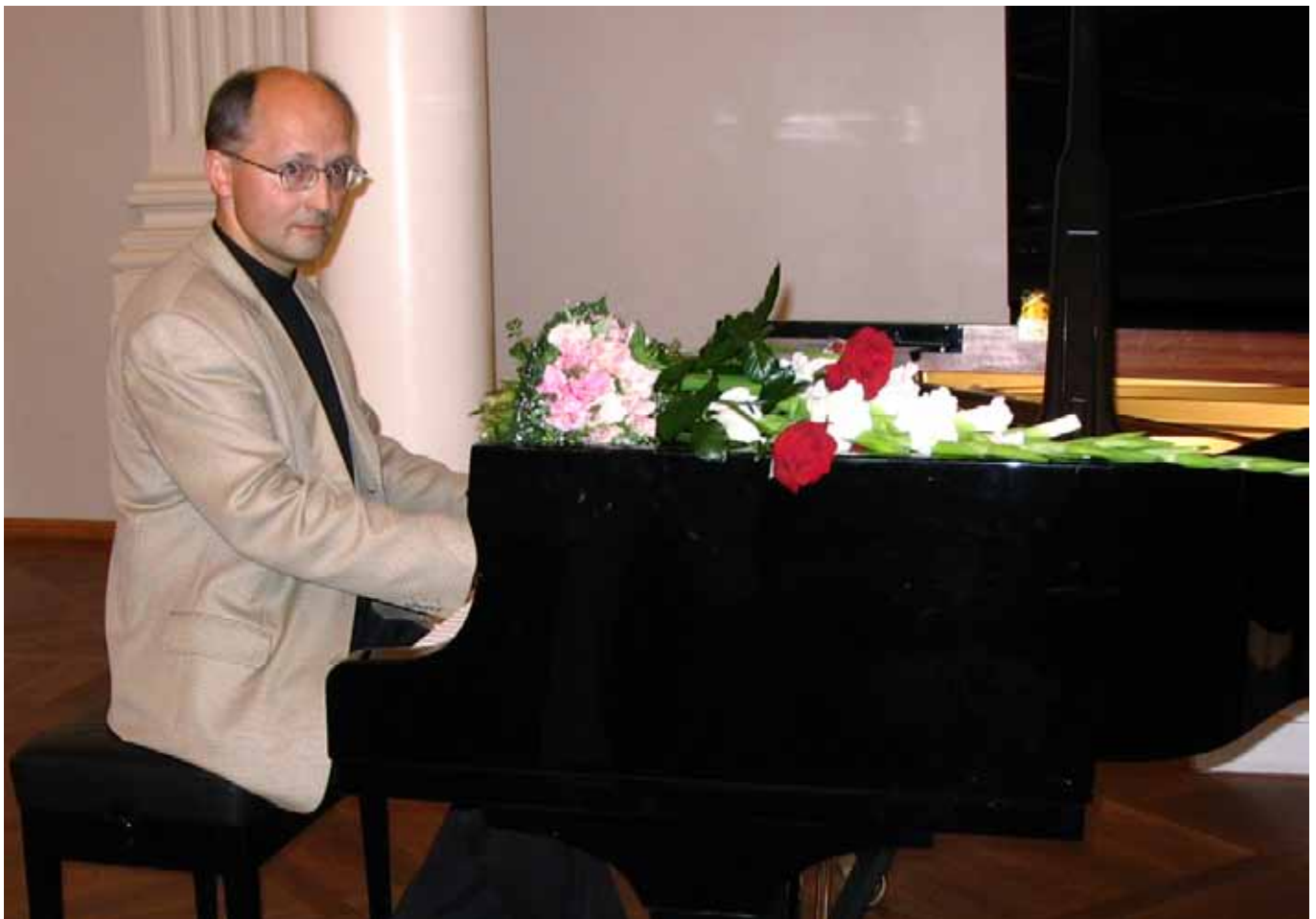
2005. aastal Tartu ülikooli aulas.