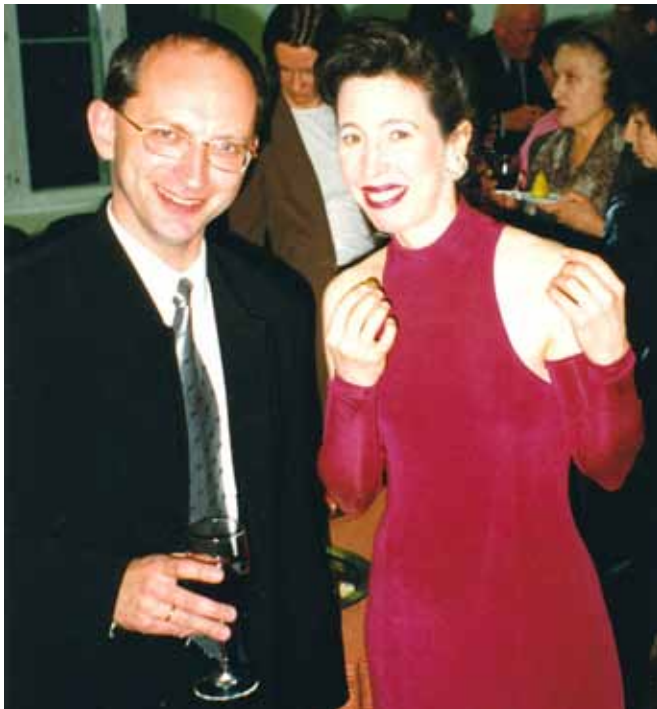
Angela Hewittiga 2002. aasta festivalil "Klaver".