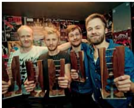
Ewerti ja draakonite järjekordne edu.