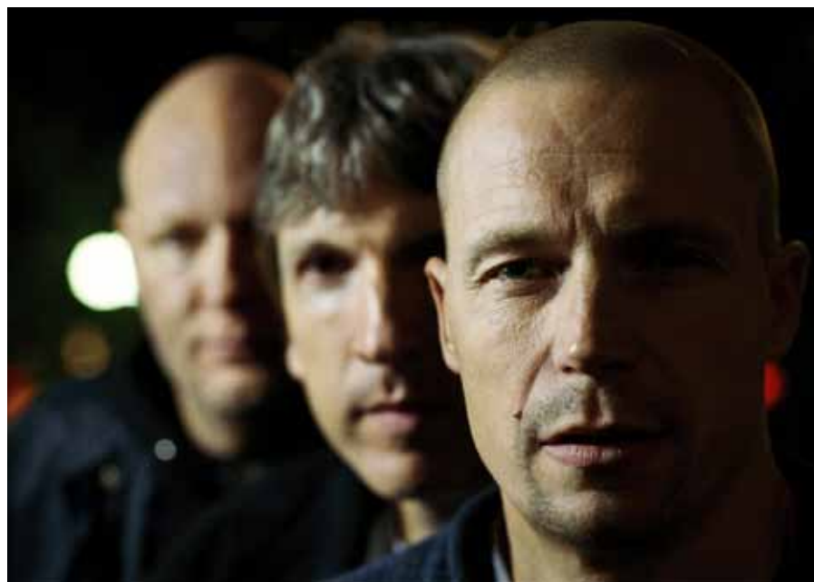
Kadunud Esbjörn Svensson koos oma ustavate triokaaslastega.

Esbjörn Svensson oli kõrgelt hinnatud muusik, kelle kontserdid töid jazzmuusika juurde noort publikut. EST, mille muusikas segunevad jazz, klassika ja rockmuusika, pidi 2008. aasta detsembris esinema ka Tallinnas “Jõulujazzil”.