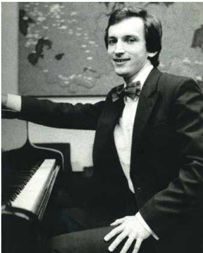
Noor interpret 1981. aastal.