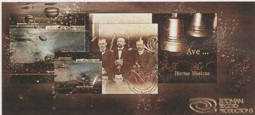
Näited ERPi edukamatest projektidest: "100 aastat eesti sümfonismi", "Ave..."