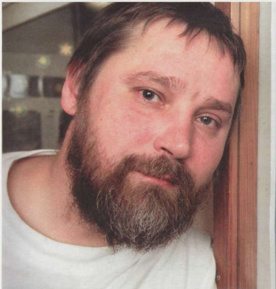
Taevatähtedest lugu pidav Urmas Sisask on kirjastuse Edition 49 üks populaarsemaid heliloojaid.