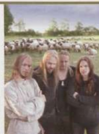
METSATÖLL FOTO ANDRES TOOM

Tellimine: AS Express Post Maakri 23A, 10145 Tallinn Tel 6662535, www.tellimine.ee Tellimisindeks 00679 Otsekorraldus 21 krooni number 3 numbrit 69 krooni 6 numbrit 138 krooni Aastatellimus 245 krooni Muusikaõpetajatele ja -õpilastele aastatellimuse soodushind 192 krooni. Soodushind kehtib ka pensionil olevatele muusikaõpetajatele. Tellimine: ia@ema.edu.ee, herje@ema.edu.ee, 6675 788, 55 56 18 94