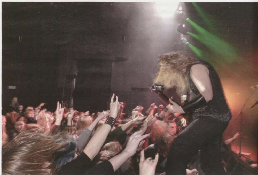
Markuse hetk rahvaga.

Eesti metal 'ikultuuris olevaid inimesi, kes aktiivselt tegutsevad ja kontsertidel käivad, on mingi piiratud hulk, näod on kogu aeg samad. See on nagu väike kyla, mis ei ole yhes kohas koos, aga neid seovad yhised huvivid. Nad vahetavad muusikat ja neil on millestki rääkida. See liidab subkultuuri tihedalt kokku. Yhendab ka see, et teised ei saa sellest aru, et miks nad kannavad nahktagisid ja kuulavad sellist muusikat. "Noh, mõni lu-