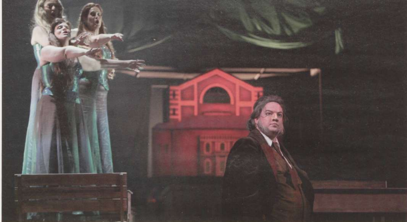
Reini tütred ja Alberich.