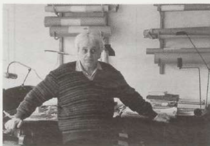
Täppisteaduslik poeet György Ligeti (1923–2006).