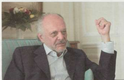
"Õnnistagu sind jumal!", lausub Toscanini kord noorele Lorin Maazelile, kellest tänaseks on saanud hiilgava karjääriga, kardetud ja armastatud dirigent.