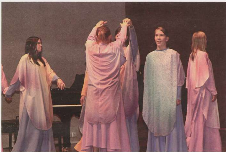
Noortekoor Sympaatti Soomest, rahvalaulukonkursi grand prix .

Tõeliselt nooruslik festivaliõhkkond valitses Pärnu kontserdimaja saalis 26. mai kontserdil "Meie tuleme!", kui üksteise järel astus üles kaheksa laste- ja noortekoori. Sinivalges rüüs väikesed Pöial-Liisid Pärnu Kunstide Majast laulsid armas-lapselikul moel merelaule, neiud Narva lastekoorest Etnos esitasid vaheldusrikast slaavi rahvalaulude kava lüürilistest lauludest ehtsa pljaskani välja. Noored väarikad ja eestlaslikult tõsised mehed Pärnu Noorte Meeskoorist laulsid traditsioonilist laulupeorepertuaari; Soome noortekoori Sympaatti iseloomustas