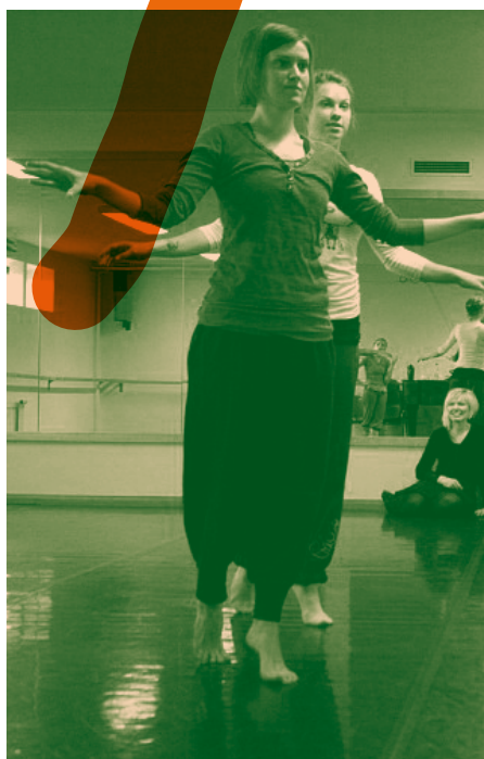
Viljandi kultuuriakadeemia kompositsioonitunnis

Tervet artiklit saab lugeda Õpetajate Lehe elektroonilisest versioonist aadressil: www.opleht.ee/?archive_mode=article&articleid=6485 ●