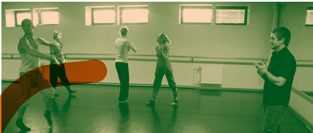
Viljandi kultuuriakadeemia kompositsioonitunnis

Kui lugeda tantsuteoreetikute artikleid, siis jätab kontaktimprovisatsioon füüsikaülesannete lahendamise mulje. Kesksed mõisted on tasakaal, kangimehhanism, ümber telje pöörlemine, tsentrifugaaljõud, mass, impulss. Samad mõisted on aga maadlusõpikuteski. Muusika järgi kontaktimprovisatsiooni enamasti ei tehta. Kas see siis on üldse tants? On küll, sest seda tehakse püsivas voolamises, tundes rõõmu liikumisest.