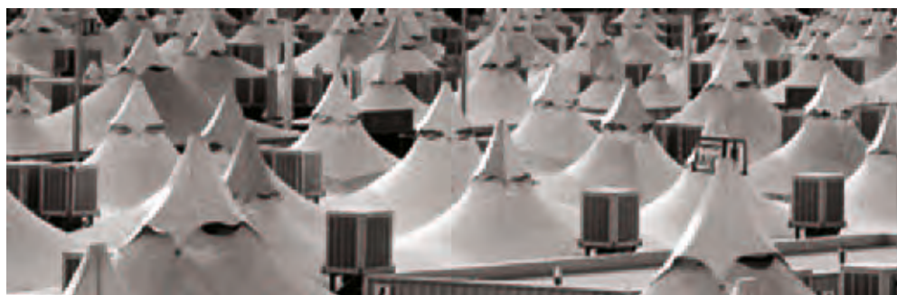
Piltidel: ülal vaade Mediina mošeele ja surnuaiale, keskel Mediina mošee kuppel, Kaaba uks, all Mina telgid.