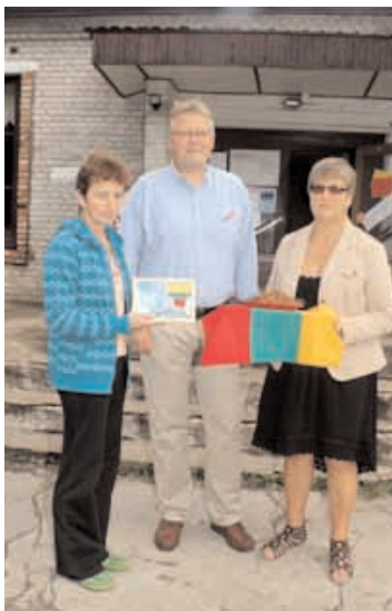
Leedu delegatsioon piiskopiga.