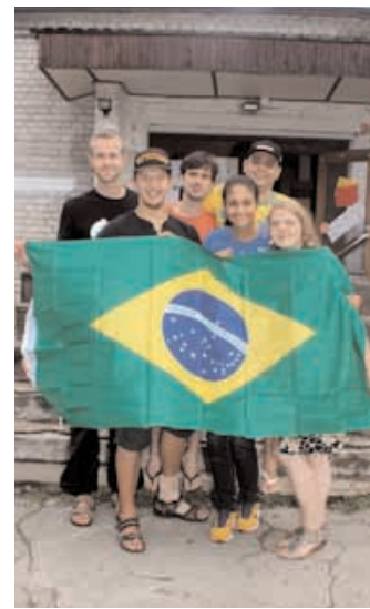
Brasiilia grupp suvemisejoni meeskonnaga.