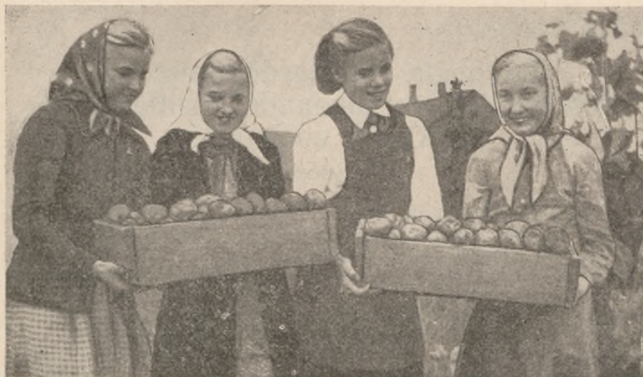
400 g kartulikoori andis sügisel 10 kg toredaid mugulaid Võru III MTK katseaias .