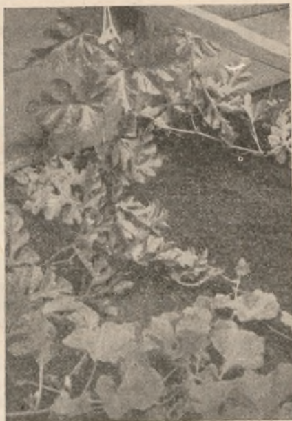
Arbuusi ja kõrvitsa hübriidid Võru Keskkooli katseaias (ülal).