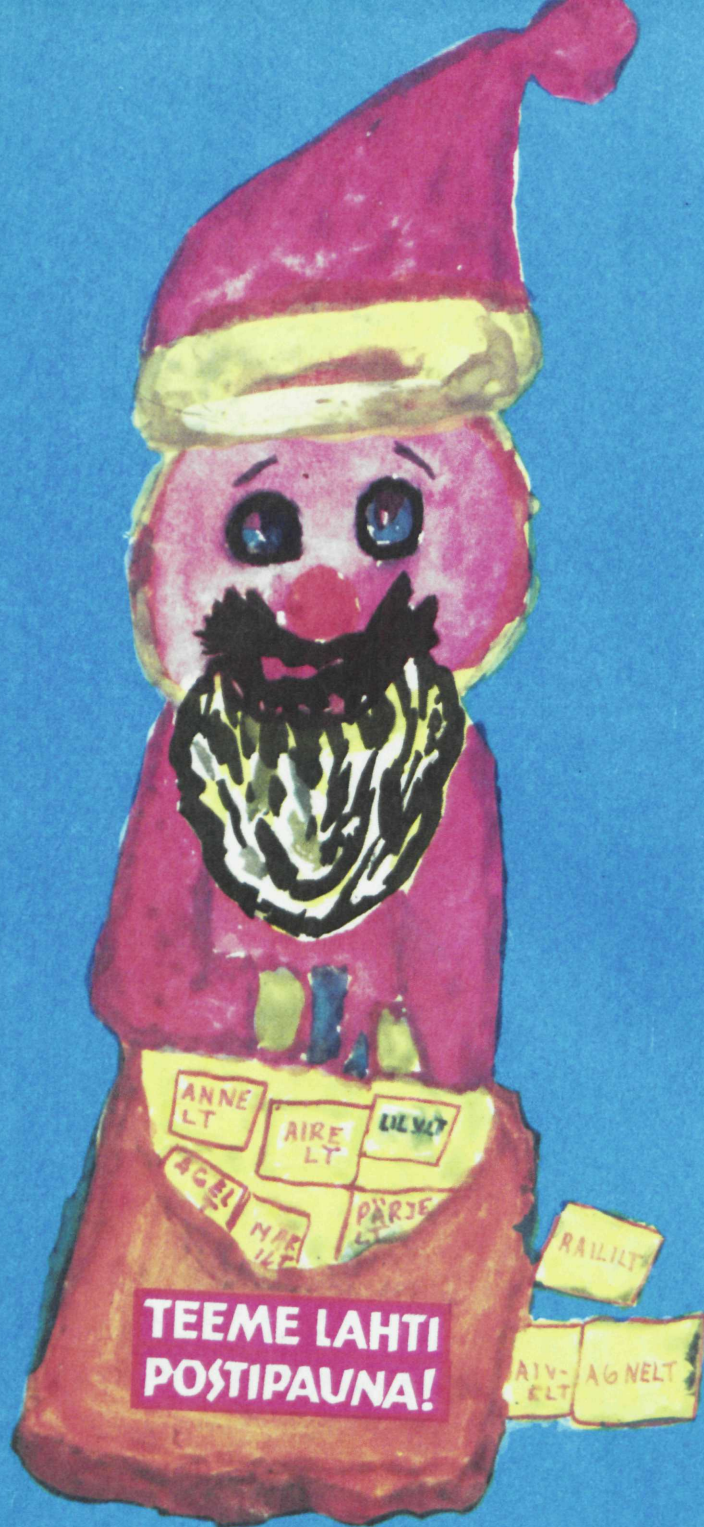
AIRE MARTINI joonistus «Näärivana».