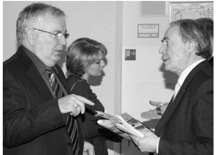
► Tiit Vähi tegeles Peterburi visiidil Sillamäe Sadama uute projektidega.

Peterburis koos linnapea ning äri- ja kultuuridelegatsioonide visiitide ja kohtumistega.