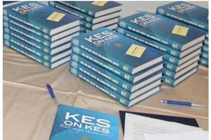
▲ Eesti Kaubandus-Tööstuskoda esitles oma 85. aastapäeva pidulikul vastuvõtul majandustegelaste leksikoni „Kes on kes Eesti majanduses 2010?“ Leksikoni koostab ja kirjastab Eesti Kaubandus-Tööstuskoda iga viie aasta järel oma juubeliaastal. Kaks varasemat raamatut ilmusid aastatel 2000 ja 2005.

Kriisi jooksul on keskmise ettevõtte suurus kahanenud üheteistkümnelt töötajalt üheksani. Pange tähele! Keskmine Eesti ettevõtte on niinimetatud mikroettevõtte. Ja küsigem nüüd iseendalt, head ametnikud ja riigiisad, kas nii ulatuslikud ja sagedased seadusemuudatused on ikka vajalikud, kuidas küll selle üheksa töötajaga ettevõtte juht ja omanik kõigi nende muudatustega kursis olla võiks suuta? Kas äkki seda kaudu ei muutu enda teada seaduskuulekalt käitunud ettevõtja seaduserikkujaks? Samal ajal ärgem unustagem, et sama arvu töökohtade loomiseks vajame nüüd rohkem ettevõtlike inimesi kui enne. Kas me mitte selle pideva muutmisega ja seda kaudu halduskoormuse kasvuga ei tapa ettevõtlikkust nii mõneski ettevõtlikus inimeses lõplikult? Ei pea olema nobelist, et aru saada, lisaks iga üksiku töötuks jäänud inimese eest hoolitsemisele tuleb oluliselt suure-