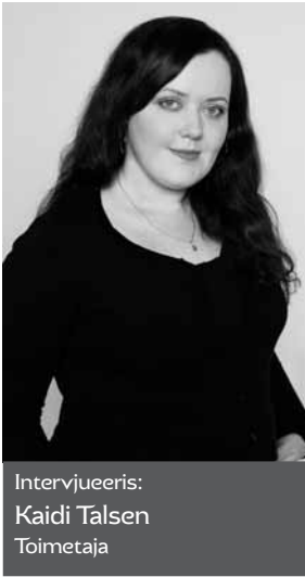
Intervjueris: Kaidi Talsen Toimetaja