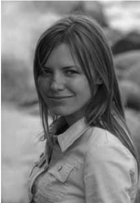
Ande Etti Koalitsiooni „Ettevõtted HIV vastu“ kommunikatsioonijuht