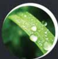
Keskkonnateenused ja ökomajandus