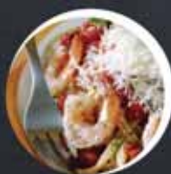
Teenindus ja tootmine