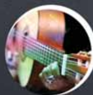
Muusika ja ürituste korraldamine