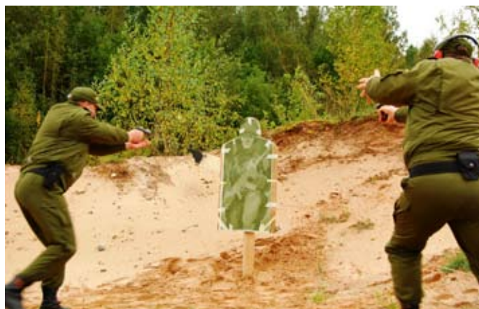
Varnja kordoni laskeharjutus, toimkonna tegevus relvastatud vastuhaku korral