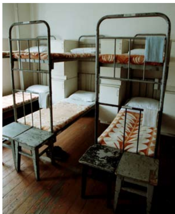
Narva kordoni magamisruum