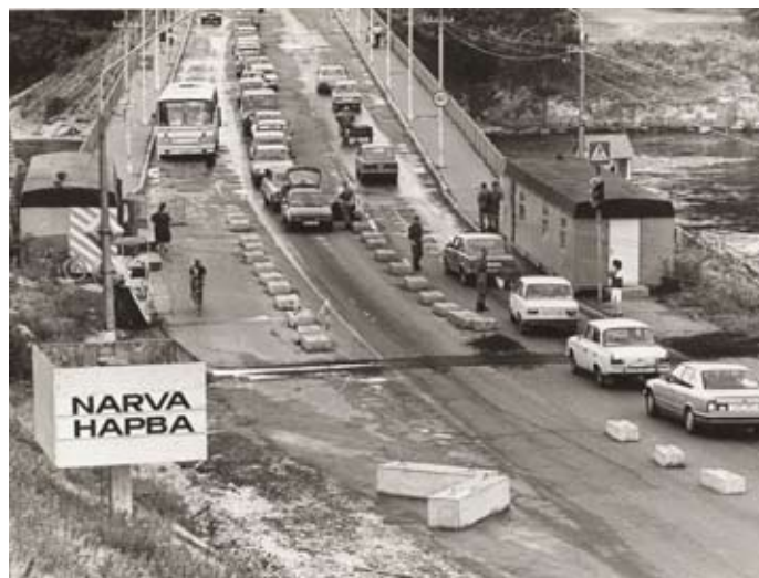
Narva Piiripunkt 1992. aastal