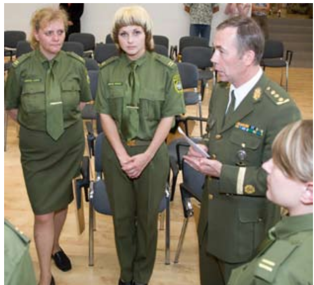
Piirivalvekolledži vastsete lõpetajatega vestlemas