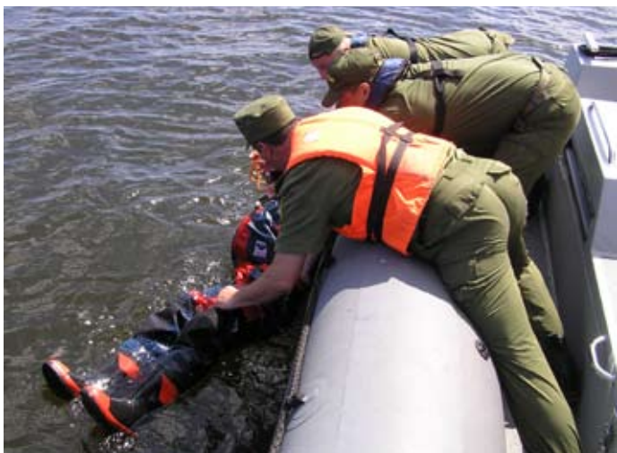
Varnja kordoni päästeõppus Peipsi järvel, kannatanu pardale tõstmine