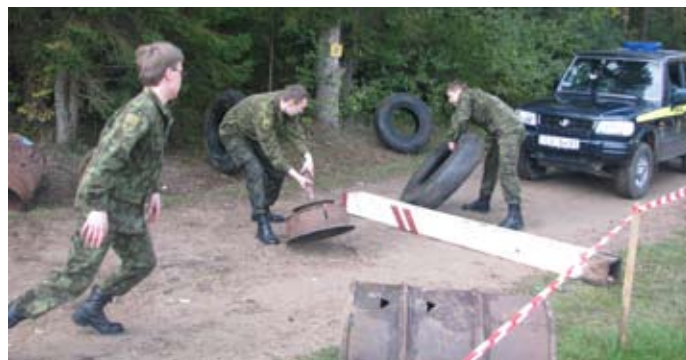
Takistusribal järjekordset tóket eemaldamas

Kahe päeva jooksul tuli kaheteistkümmel võistkonnal võistelda kümnel erineval alal, kusjuures sõidukite identifitseerimises ja dokumendi turvaelementide määramises saavutasime esikoha, võõrkeele (inglise keele) tundmises teise koha, teenistusauto vigursõidu ja oma riigi piirivalvet tutvustava presentatsiooni eest kolmanda koha. Ka ülejäänud aladel (dokumentide kontroll, lahinglaskmine, esmaabi osutamine, relvastatud kurjategija kinnipidamine piiritsooni kontrollimise käigus ja takistusriba läbimine) saavutasime keskmisest paremad tulemused.