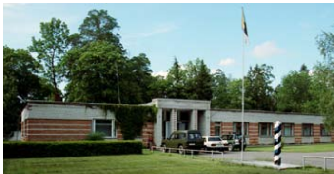
Narva-Jõesuu kordon 2001. aastal