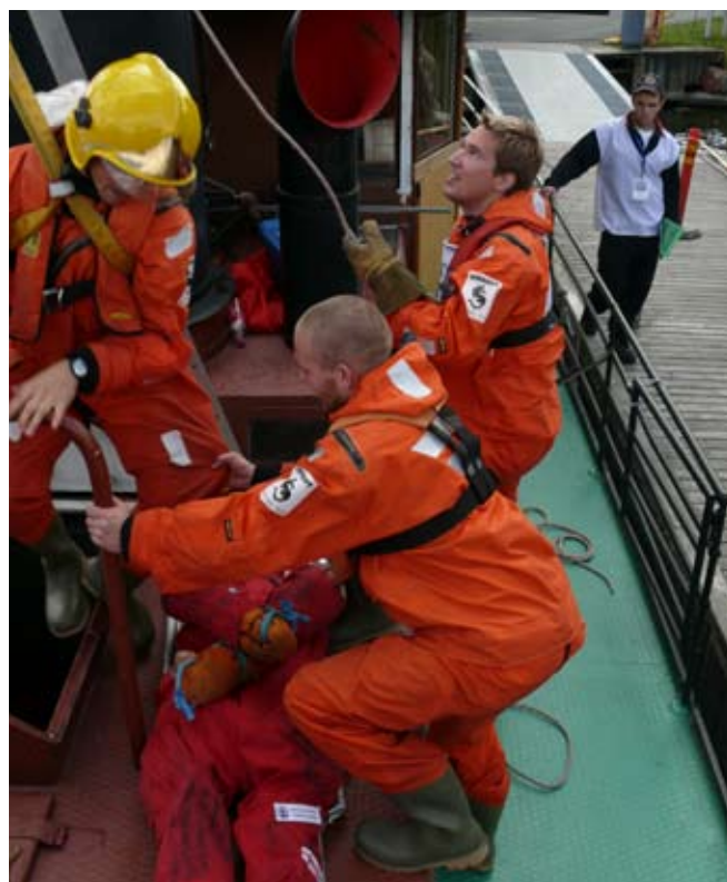
Võitjameeskond tõstab aurulaeva masinaruumist teadvuseta inimest.

Finisisse jõudmiseks pidid võistlejad paarsada meetrit päästeülikon- dades ujuma ning ilma abivahenditeta sadamakaile ronima. Võistlus oli tasavägine, kuid parimaks osutus Helsingi merepäästerühm, kes sai aastaks ajaks oma valdusse rändauhinna Merikarhu.