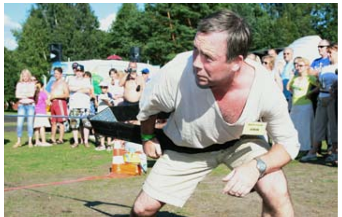
2007. aasta Perepäevadel said ülemad omavahel mõõtu võtta

Esimene suurem töö, mis piirkonnaülemana teha tuli, oli valmistamine juunikaiseks Schengeni hindamiseks. „Tegelikult oli see mulle väga kasulik, sest pidin ettevalmistuse käigus ise