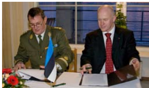
Piirivalveameti ja Keskkonnainspektsiooni vahel allkirjastati ka koostööleppelisa, mis reguleerib poolte õigusi ja kohustusi seoses uue laevaga.