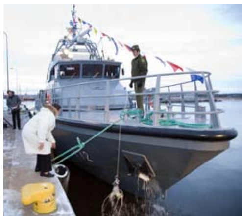
Laeva ristimine õnnestus kolmandal korral

Laevaga, mis kannab numbrit 112, hakkab keskkonnainspektsioon teostama kalajärelevalvet ning piirivalve ülesandeks jääb piirikontroll, merepääste, merereostuse seire ja ohutu mereliikluse tagamine.