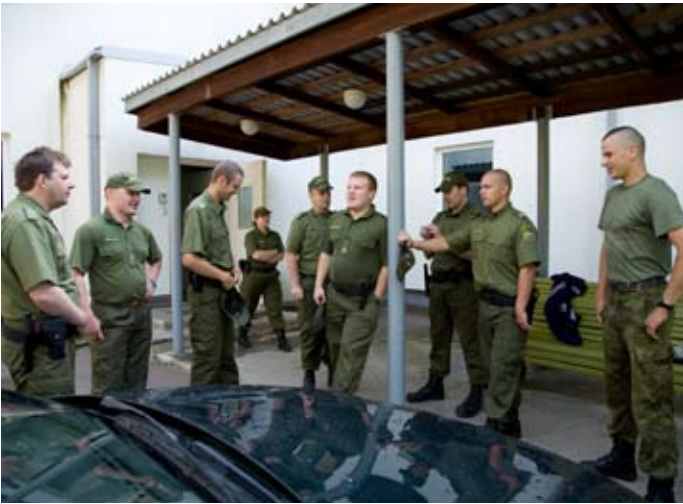
Valmidusüksuse mehed juttu ajamas

üldjuhul praktilist turvataktika trenni saanudki, teadmised on teoreetilised. Nad teavad põhimõtteid, kuidas piiri valvamisel enda ja kõrvaliste isikute ohutust tagada, aga situatsioonikäitumist ei ole saanud. "Iga olukord on oma olemuselt küll erinev, aga on olemas tüüpikäitumised ja -lahendid, seda piirivalvur üldjuhul kordonist ei saa," räägib Turba ning lisab, et piirivalvuri töö on ohtlik, kus iganes piiri valvatakse – nii palju kui on inimesi, on ka erinevaid käitumismudeleid.