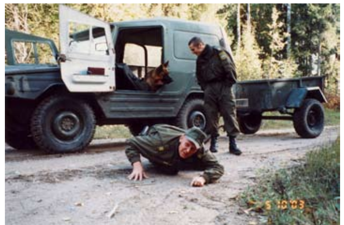
Srs Reilant "õpetab" teenistuskoeerale, kuidas jälge võtta. N-srs Künnap "suhtleb" samuti koeraga

Autor: Aarne Tasane (Varnja piirivalvekordon) Tormi eel.