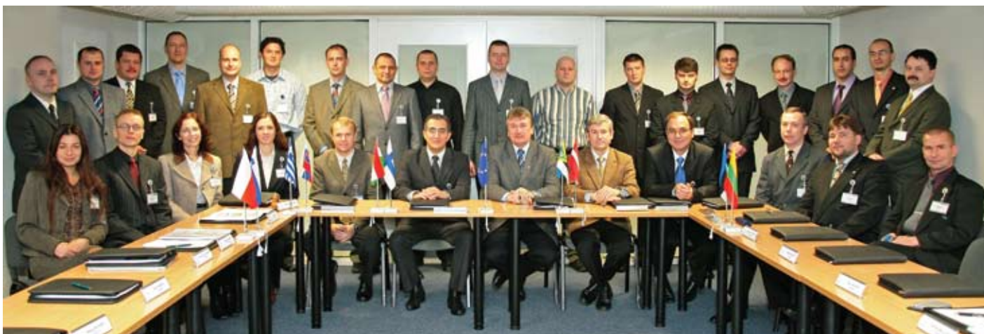
Frontexi konverents „Tactics of Green Border Surveillance“ Võrus 27.11-1.12.2006

Liikmesriikide osalus on aastate lõikes muutunud aktiivsemaks. Frontexi poolt rahastatud või kaasrahastatud operatsioonid ja koolitused võimaldavad minimeerida piirivalveorganisatsioonide kulutusi, vähendamata samas võimalust rahvusvahelise koostöö kogemuse omandamiseks. Eriti avaldub Frontexi olulisus kulukate mereoperatsioonide või naasmislendude korraldamisel.