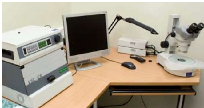
Teise astme dokumendi kontrollimise seadmed

Vajadusel pööratakse ka kolmanda astme kontrolli poole, milleks on Reisidokumentide hinnangu keskus, mis on ka viimane aste. Kui nende abi vaja ei ole, siis tegeleb teise astme kontroll võltsinguga ise, tehakse kirjeldus ja edastatakse Reisi-dokumentide hinnangu keskusele.