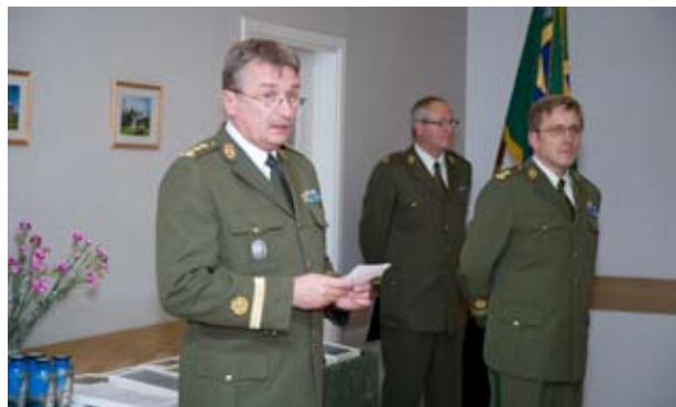
Peadirektor: “Kuni meis elavad piirivalve väärtused, elab ka Eesti piirivalve”