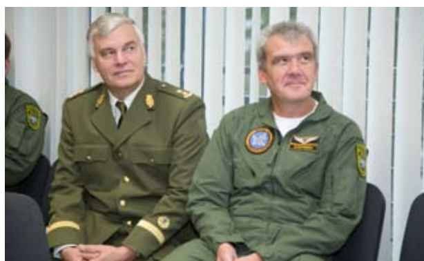
Lennukaid mõtteid Lennusalgas