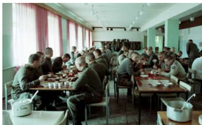
Narva kordon 1998. aastal