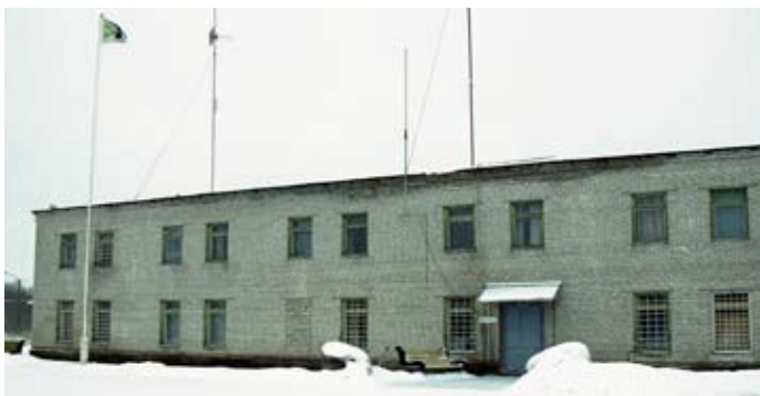
Mustajõe kordon 2001. aastal