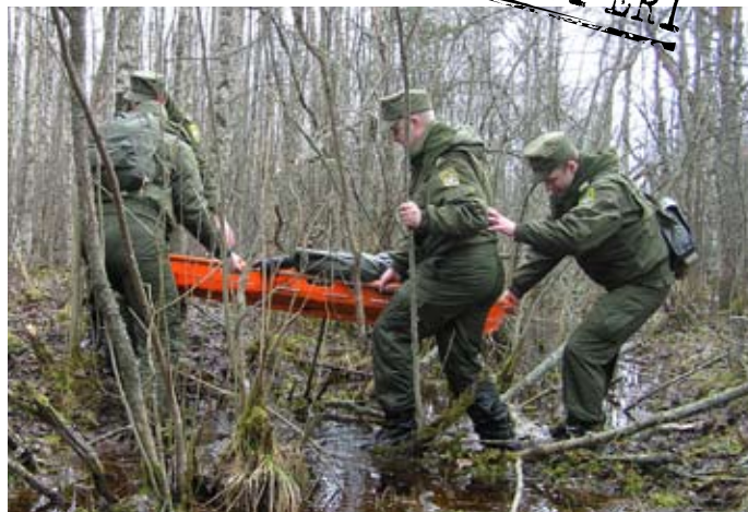
Varnja kordoni päästeõppus, kannatanu transport metsast välja