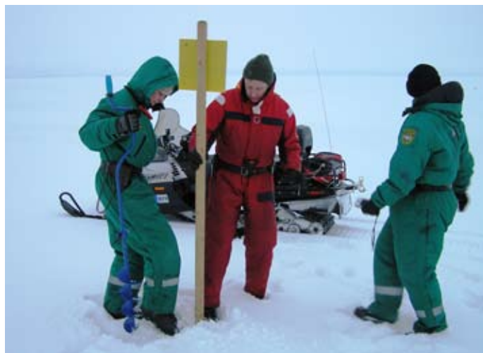
Varnja kordoni toimikond Peipsi järvel piiri tähistamas

Kui Kagu Piirivalvepiirkond tõi erilise kohana välja kolmikpunkti, siis on ka Kirde piirkonnal oma erakordne koht täiesti olemas. Ajutine kontrolljoon, mis Peipsi järvel kulgeb mööda Tartu rahulepingu järgset piiri, puutub Peipsi põhjaosas, Narva jõe alguses, kokku hiljem paika pandud ajutise kontrolljoonega, mis jookseb mööda Narva jõge. Nii on tekkinud olukord, kus inimesed Vene poolel, oleksid vette astudes ebaseaduslikult Eesti riigi territooriumil. Et kohalikud järves suplemiseks Eesti viisat ei peaks taotlema, on Eesti ja Vene piiriesindajate kokkuleppel supluskoht poidega tähistatud ning kalameestele loodud võimalus rahumeelseks läbisõiduks Eesti territooriumilt.