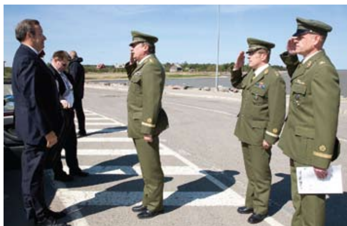
Visiidi algus: Presidendi tervitamine Saaremaal