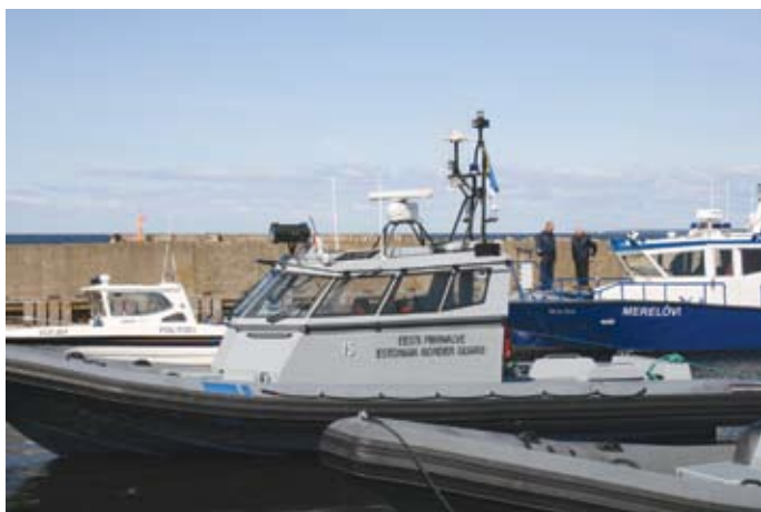
Piirivalve mootorpaat MP-15 ja politsei patrullkaater Merelõvi

Piirivalve ja politsei juhitud koostöö korraldamisel varasematest koostöökokkulepetest, mis puudutavad kattuvaid kohustusi süütegude ennetamisel, illegaalse immigratsiooni avastamisel ja tõkestamisel ning avaliku korra tagamisel.