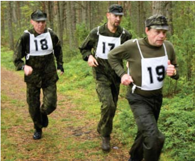
Kanep jooksurajal mõõtu võtmas

Enamik laskureid oli alguses “mehed metsast” ja neid hakkasime nullist treenima ja nendega siis võistlustel käima.