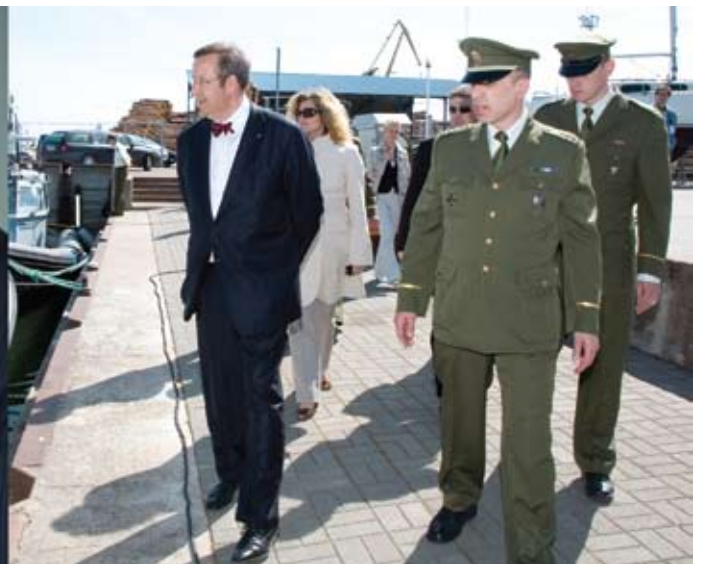
President tutvumas piirivalve tehnikaga