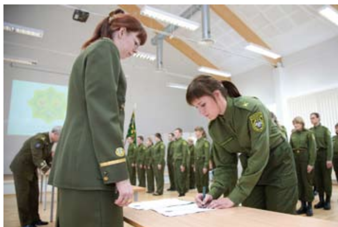
Vandele alla kirjutamine

4. aprillil andsid Piirivalvekolledžis piirivalveametniku vande üks kõrghariduse ja kaks kutseõppe rühma, kokku 58 kadetti. Esmakordselt leidis vande andmine aset Piirivalvekolledžis, sest tulenevalt piirivalveteenistuse seadusest ei anna noored piirivalvurid vannet enam piirkondadesse tööle saabudes,