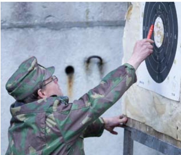
Pärast laskmist märki uurimas

Ma palju ei räägi, aga kui ütlen, siis on mõte taga ja tavaliselt õige mõte. Ja kui olen kellelegi midagi lubanud, siis teen ka ära.