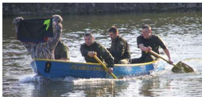
Piirivalve võistkond edestas konkurente

Kuressaare Ametikooli algatatud ja läbiviidav üritus Vallikraavi Veeralli on Kuressaare linnusekraavis peetav traditsiooniline veesõidukite võidusõit, kus võisteldakse kolmes kategoorias: Kasse tüüpi paadid, kanuud ja mootorita alternatiivsõidukid. Kasse paadiklassis on igas paatkonnas viis liiget, kellest üks on taktilugeja, teine prominent, kolmas näkineid, lisaks on kaks lihtliiget.