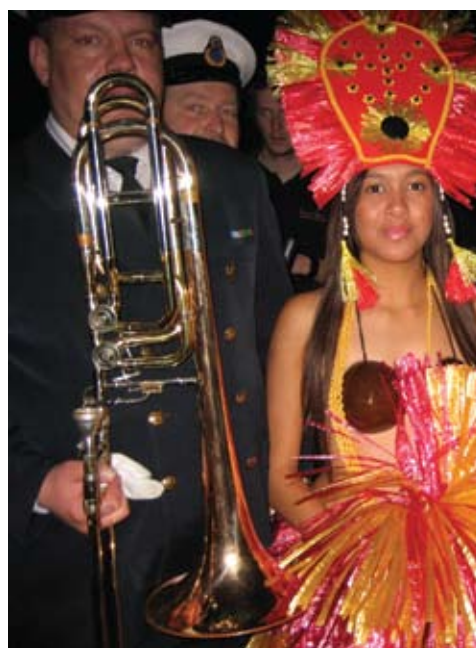
Police Tattoo esinenud tantsijad pakkusid silmailu