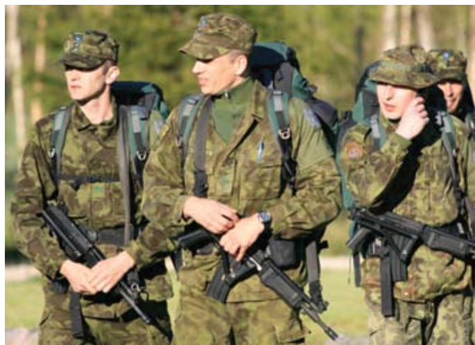
Avarivistus: mehed on valmis raskele katsumusele vastu minema

Võistluseks valmistusime Tallinnas Männiku tiirus, kus harjutasime laskmist ja töötasime läbi varasemate aastate võistluse ülesandeid. Lisaks soetasime Piirivalveameti toetusel juurde varustust, energiajooke ja taastusvahendeid.