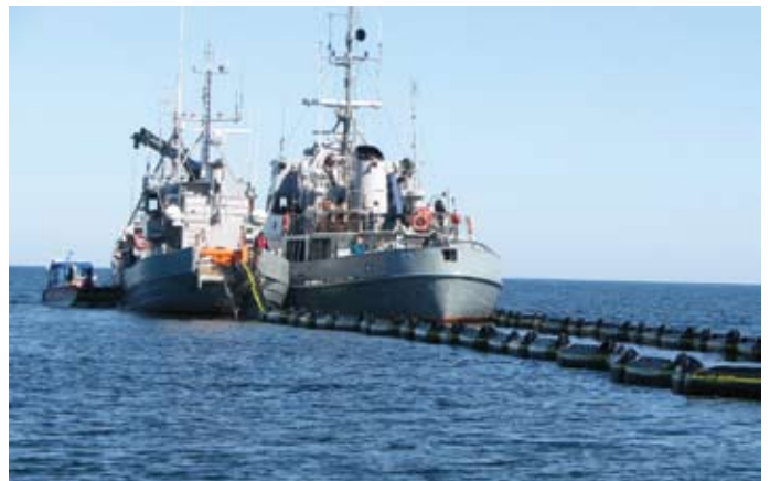
Piirivalvelaevad Kati ja Kõu