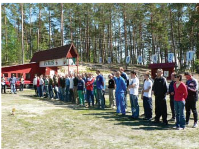
Mõni hetk enne starti