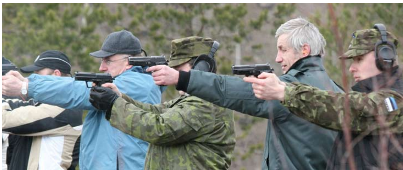
Kaasvõitlejad võtsid mõõtu lasketiirus

Kõik osalejad jäid reisiga väga rahule. Aitäh organiseerijatele ning loomulikult suur aitäh võõrustajatele – Idapiiri Ohvitseride Kogule!