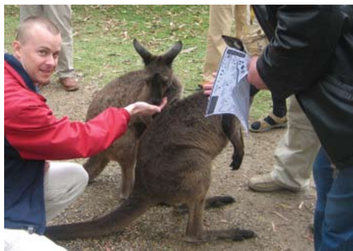
Vabal ajal kohati ka kohalikke imeloomi, kangurusid