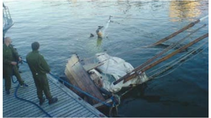
Naissaare lähedal õnnetusse sattunud Rannarootsi jaala merebaasi sadamas

Üks naljakas lugu veel ajast, kui töötasin Kärddla mere- pääste allkeskuses. Kord võttis raadio teel sidet Vene kau- balaev ja küsis ilmateadet. Kuna meil venekeelset ilmatea- det ei olnud, siis hakkasin seda eesti keelest tõlkima. Asi sujus kenasti kohani, kus ilmateates oli “muutliku suunaga tuul”, vot siis oli mõistus otsas! Kuid leidlik, nagu ma olen, teatasin soravas vene keeles: “Veter duujet otsjuda otuda”. Seda meenutatakse ja naerdakse siiani.