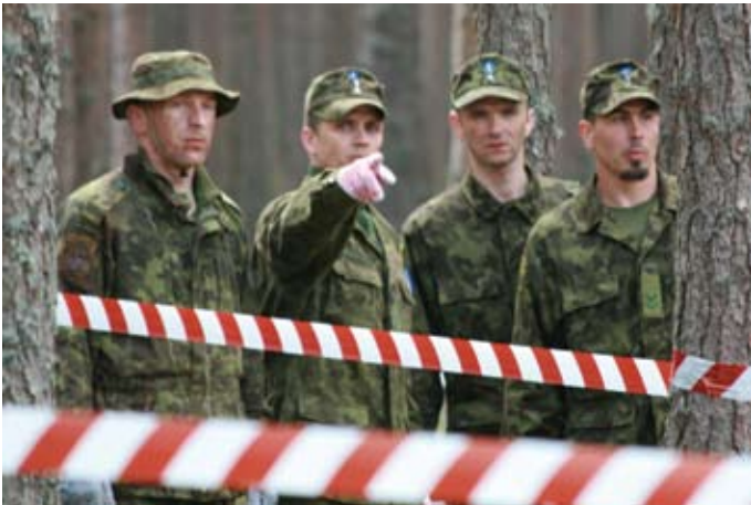
Võistkond ülesande ootel