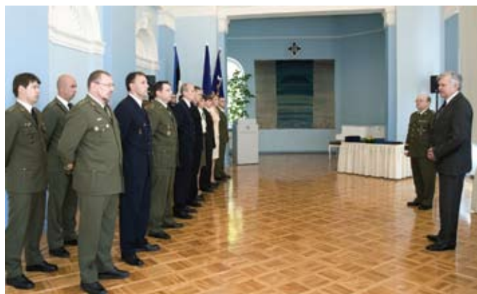
Pidulik rivistus enne auastmete andmist