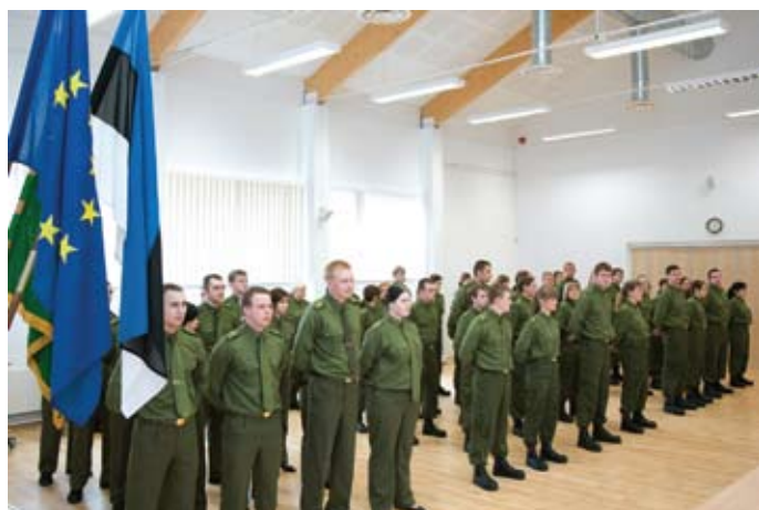
Kadetid rivistuses piirivalveametniku vande andmise eel

4. aprillil andsid Piirivalvekolledžis piirivalveametniku vande üks kõrghariduse ja kaks kutseõppe rühma, kokku 58 kadetti. Esmakordselt leidis vande andmine aset Piirivalvekolledžis, sest tulenevalt piirivalveteenistuse seadusest ei anna noored piirivalvurid vannet enam piirkondadesse tööle saabudes,