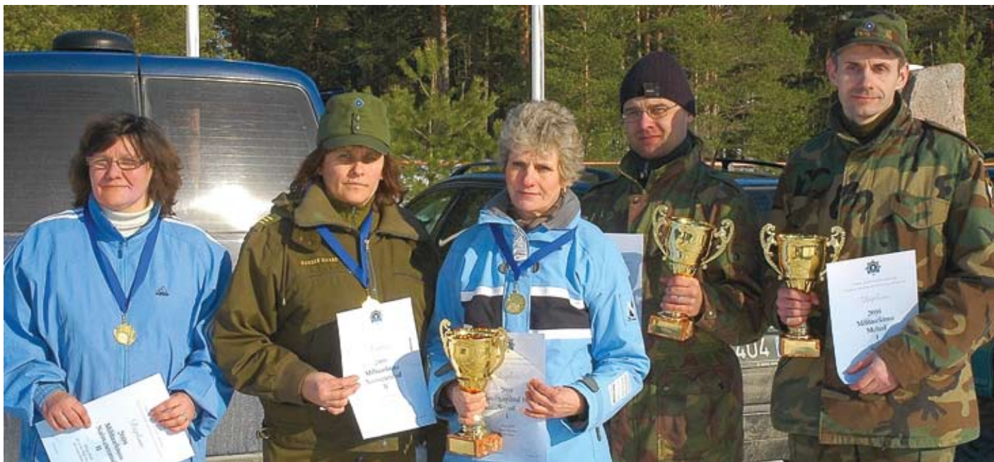
„Talveots 2008“ võitjad

piirivalveseersant, Põhja Piirivalvepiirkonna personalijaoskonna staabiallohitser