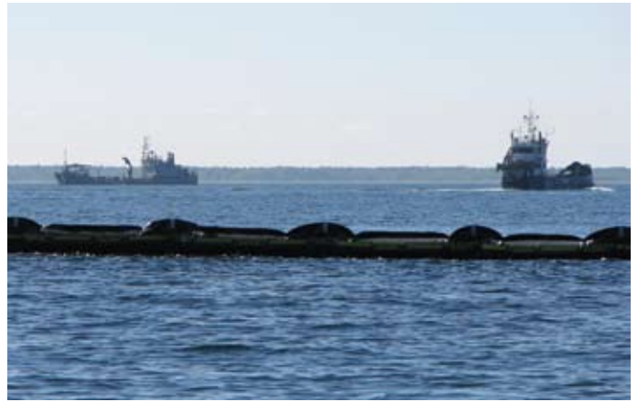
(vasakult) Soome Mereväe laev Hylje ja eraettevõtte Finstaship laev Oili1

Õppusele järgnenud briifingul rõhutati veel kord selliste õppuste vajalikkust ning vajadust neid ka edaspidi korraldada. Õppusega jäid rahule osalejad nii Eestist kui Soomest. Ka Operatiivinformatsiooni- ja mereseirekeskuse tegevusele õppuse koordineerimisel anti positiivne hinnang.