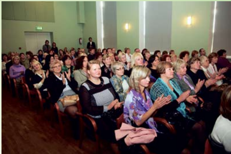
„Millal mina viimati õppisin?”