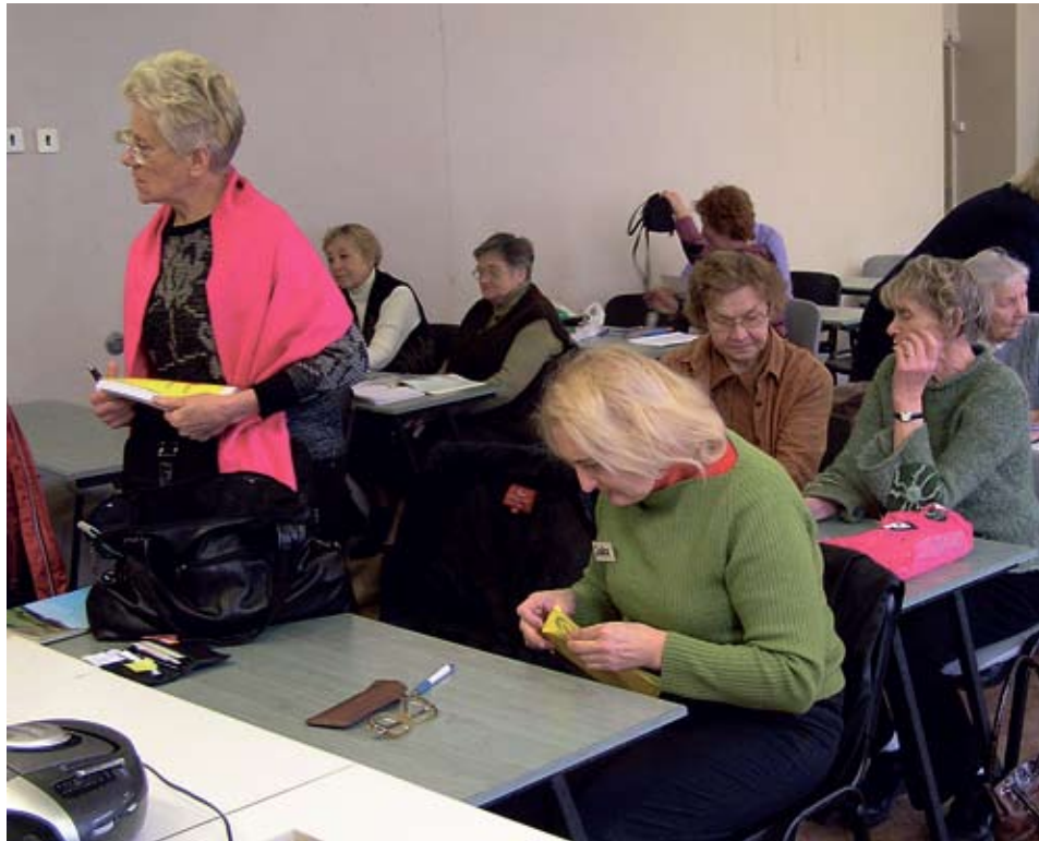
Saksa keele tund kolmanda nooruse ülikoolis.

Kursuslased on koos kolmandat korda ja õpetaja klassi ees meenutab kiiresti eelmisel kordadel õpitut ning võtab käsile kodu teema. Selgitab, kuidas nimetatak-