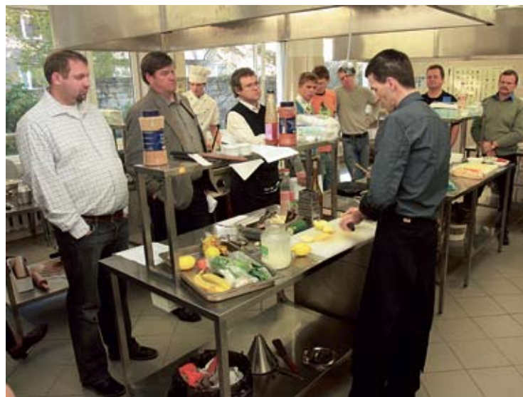
Saare mehed kokkamas.