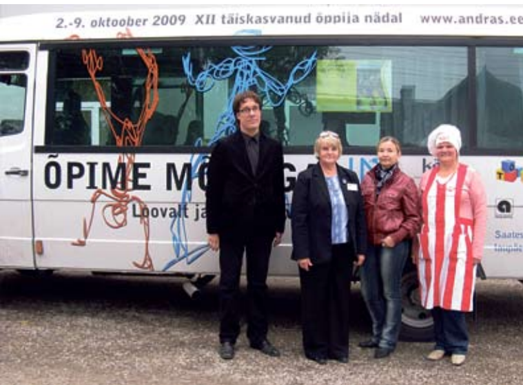
Õpibuss tuli külla Valgamaale.