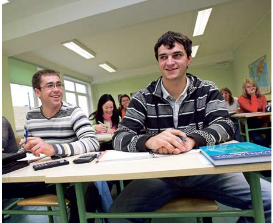
Noorukid Tallinna täiskasvanute gümnaasiumis.

Eestis on üle 80 000 töötut. Ilma põhihariduseta konkurentsivõime vastu ei pea.