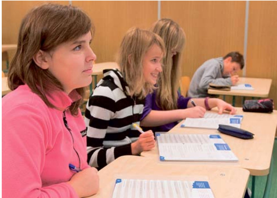
Keeletund Tallinna Rahumäe põhikoolis. Selles koolis on õpilastele abiks keelemapid.

Keeleoskust kirjeldatakse osaoskuste kaupa: mõistmine – kuulamine ja lugemine rääkimine – suuline suhtlus ja suuline esitus ning kirjutamine.