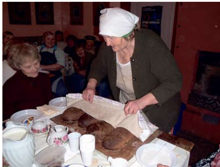
Järvemaal õpiti leivategu.