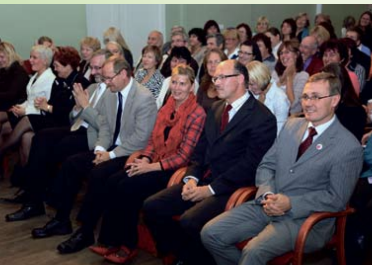
Vana tõde: rõõmus meel hoiab vaimu erksa. Paremal haridus- ja teadusminister Tõnis Lukas.