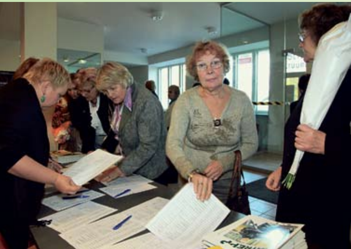
Täiskasvanud õppija nädala (TÕN) avatseremoonial osales üle 300 inimese erinevatest Eestimaa paikadest.