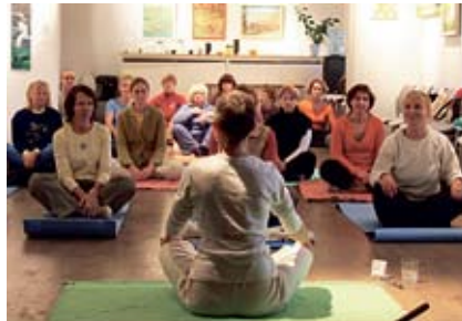
Kundalini jooga Jõgevamaal.

Milles siis avaldub selle valla koolitussõbralikkus? Mõned näited: valla allasutuste ruumid on MTÜ-dele ja tegusatele inimestele tasuta kasutamiseks. Vald on kaasrahasutanud mitmeid kodanikualgatusi, MTÜ-d ja raamatukogud on võrdväärset partnerid. Iga piirkond saab juba mitu aastat suvise ekskursiooni korraldamiseks 5000 krooni toetust, et pakkuda täiskasvanud elanikele võimalust silmaringi avar-