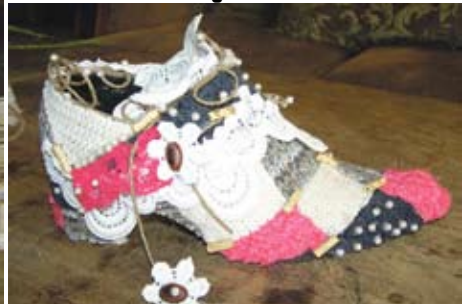
Vana kinga uus elu