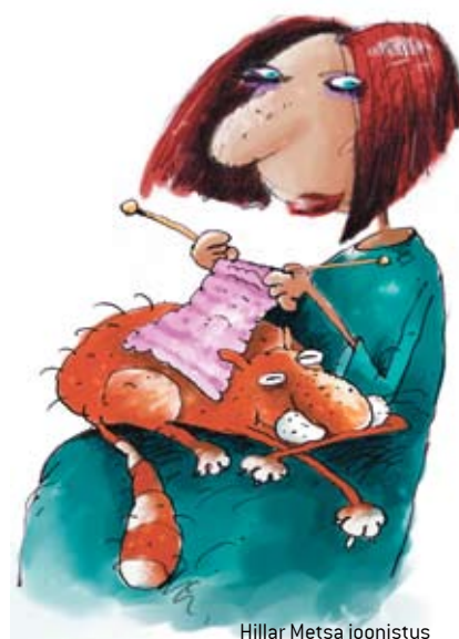
Hillar Metsa joonistus

• Vajalikud telefoninumbriid aadressilt: www.kultuur.edu.ee/602905