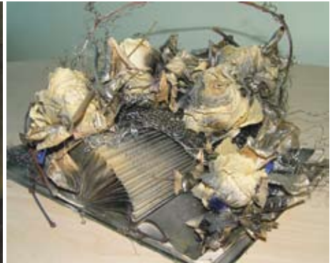
Vana raamat roosidega