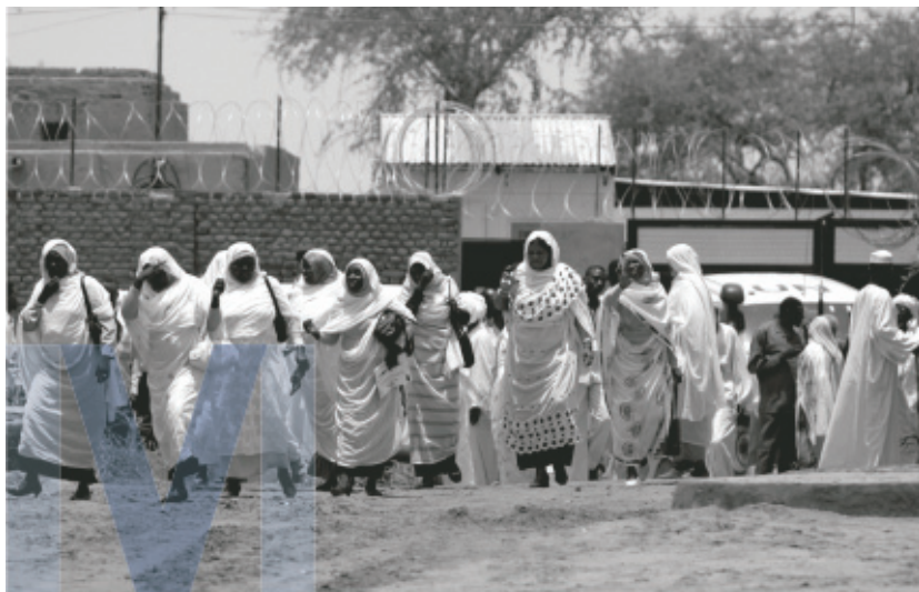
Sudaani naised lahkumas ÜRO missiooni UNMISi territooriumilt el-Fasheris, Põhja-Darfuri pealinnas ÜRO peasekretäri Ban Ki-mooni külaskäigu ajal 5. septembril 2007. Kohtumine ÜRO peasekretäri ja riigisisest ümberasustatud isikute esindajate vahel jäeti ära, kui väidetavalt ümberasustatud isikud koosolekut takistasid. Ban Ki-moon külastas konfliktis lõhestunud Sudaani Darfuri piirkonda ning tunnistas, et rahvusvaheline üldsus ei ole piisavalt pingutusi teinud, et lõpetada neli aastat kestnud sõda ja kannatusi.

kui nad oleksid missiooniga koostööd teinud. Nad küll kohtusid meiega, kuid ei lasknud meid riiki sisse ja ei lasknud meid hoopiski sinna Darfuri piirkonda, kus katastroofpõhiliselt aset leiab.