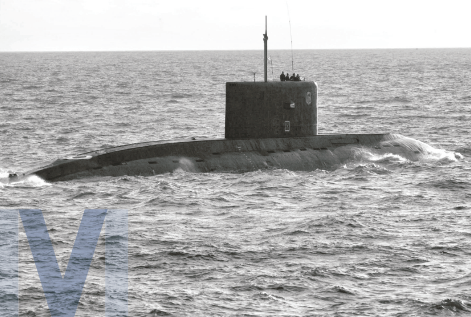
Vene Balti laevastiku allveelaev Kaliningradi lähedal õppustel. Juuni 2007.