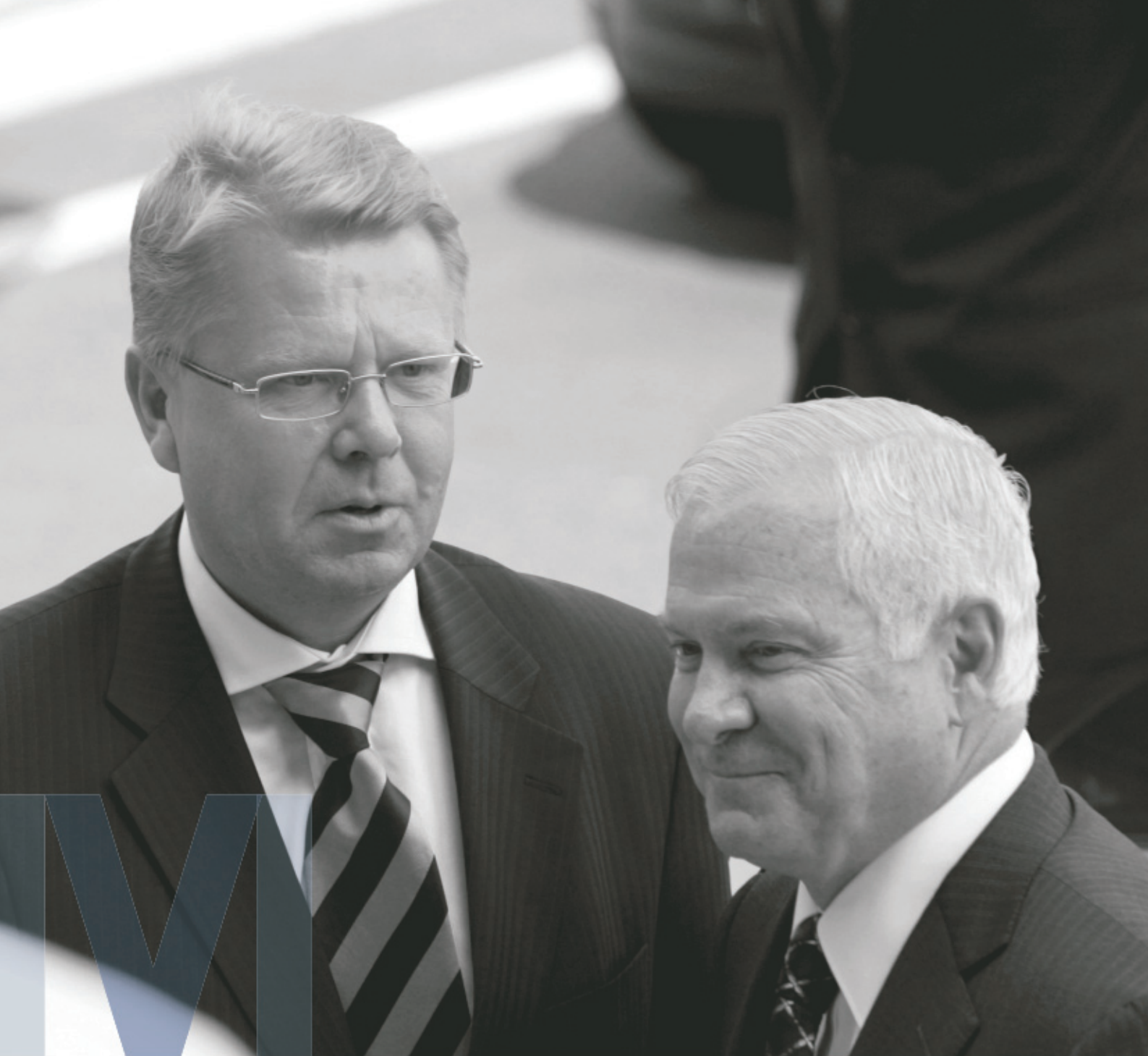
Ameerika Ühendriikide kaitseminister Robert Gates tervitab Soome kaitseministrit Jyri Häkämies (vasakul) Pentagonis 7. septembril 2007 toimunud auvahtkonna tseremoonial.