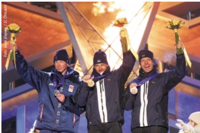
Kaks eestlast korraga olümpiapjedaalil.

1999. aastal langetati otsus majutada meie murdmaasuusatajad, laskesuusatajad ja kahevõistlejad võistluspaikade lähedusse Homestead Resorti puhkekülal ning kindlustada seal nende toitlustamine. Majutamise ja toitlustamise kohta sõlmiti lepingud. Kokku broneeris EOK majutused murdmaasuusatamise, laskesuusatamise, kahevõistluse ning suusahüpete sportlastele ja abipersonalile. 36 delegatsiooni