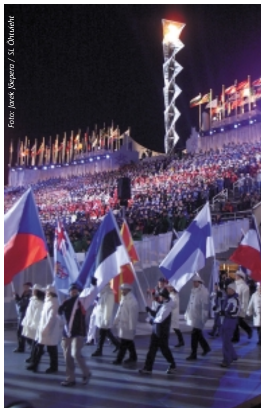
Olümpiamängudel osales 78 maad.

Arvestades liitude ettepanekute ja eduvõimalustega, otsustas täitevkomitee kinnitada delegatsiooni veel 18 liiget: 6 treenerit (2 murdmaasuusatamise, 2 laskesuusatamise, 1 kahevõistluse ja 1 iluuisutamise treener), 10 hooldemeeskonna liiget (5 meeste ja 4 nais-