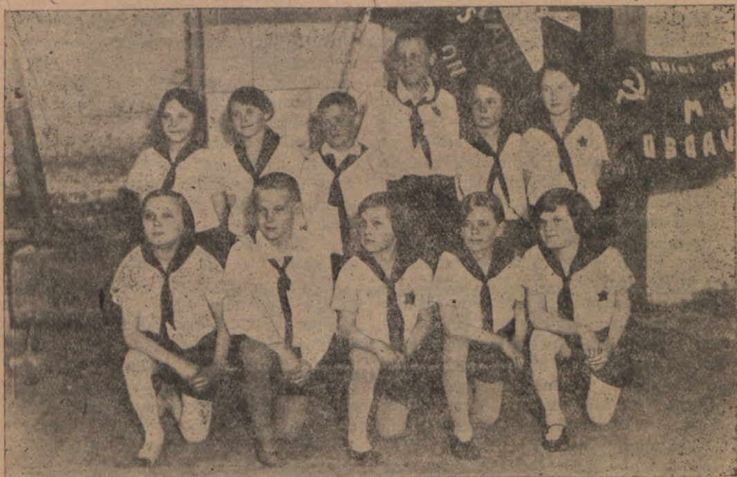
Mehodati (Tomski ringkond) pioneerrühm.

gets, kui ema juba mu „hinge“ eest hoolitsemata hakkas: pidin lauluraamatust pähe õppima laulu „Üks roosike on tõusnud“. See oli kõige rassem töö mu elus. Võimata oli lapse aruga sellest aru saada, mis roosist seal jutt on, kes on see Jesse, kelle „soust“ ta tuli, kuidas sai ta „keft talvel külmal ajal“ üles kasvada. Kõik need asjad olid mulle mõistatused, ka ema ei osanud mulle seletada, nii et ma aru oleks saanud. Raske waewaga, ema õnnetut saatust wandudes, tuupisin esimese salmi oma seitsmeaastasest ajuse, teise salmiga aga jäin pigisise; seda ei osanud ma emale kõige parema tahtmisega ette lugeda. Talvel wuristas ema peaaegu päewa läbi wolkki. Istusin juures ja kordasin teist salmi: „Mu armsast roosikest, Jeesajas kuulutas: Ta sündis puhast neitsist, Mariast, Betlemmas“. Kes oli see Jeesajas? Mis asi see „puhas neitsi“ on? Need küsimused löid peas hundiratast. Tihti sai ema pahaseks, kui ma ta nõudmise peale seda „hingeõnnistuseks“ waja olewat kraami peast lugeda ei suutnud. Siis sain togida ja pidin nuttes edasi lugema. Mis oli mul