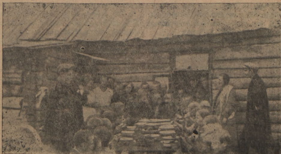
Medodati ja Lillenhoji (Tomski ringkond) koolilapsed ekskursiooni ajal N. Klementi nim. sp.-m. artelli ühislaudas lõunat sõdmas.

panewad, ja kehwituid ja keskmikke, ilma et nad neile kollektiiviseerimist ja selle tähtsust selgitaksid, otsukohe igasuguste ähwarduste ja sundimisega kollektiivi püüawad fihutada.