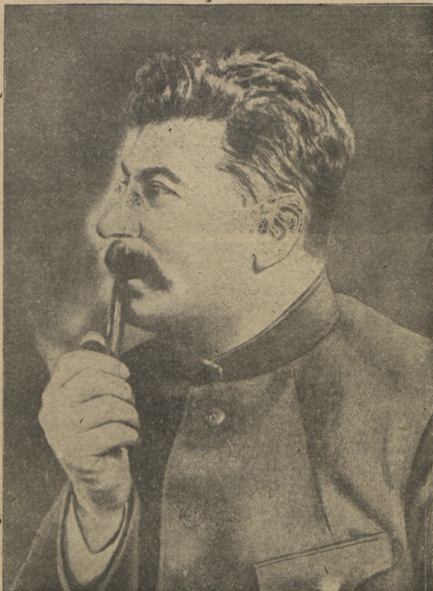
Sm. J. Stalin