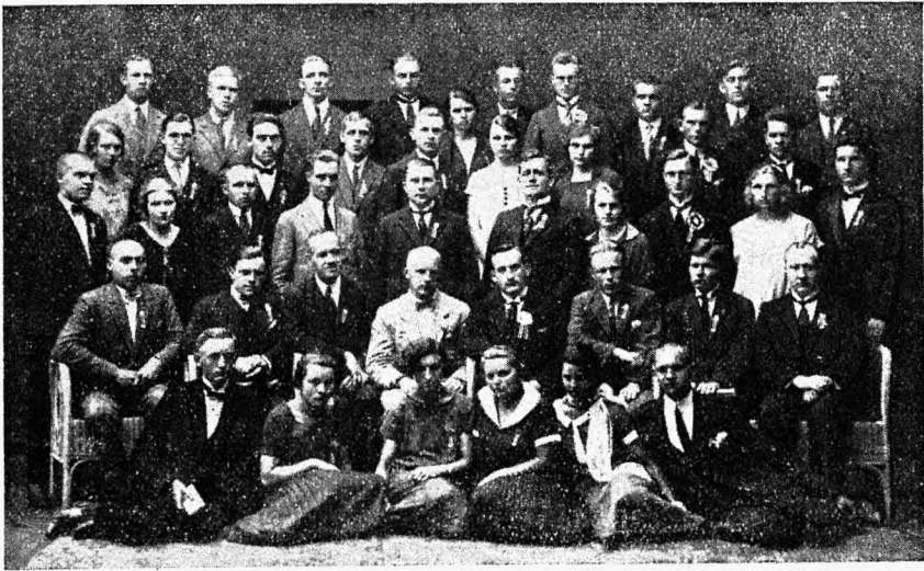
III üleilmisest üliõpilaste karskuskongressist osavõtjaid Tartus, suvel 1926. (Pildil umbes pooled)