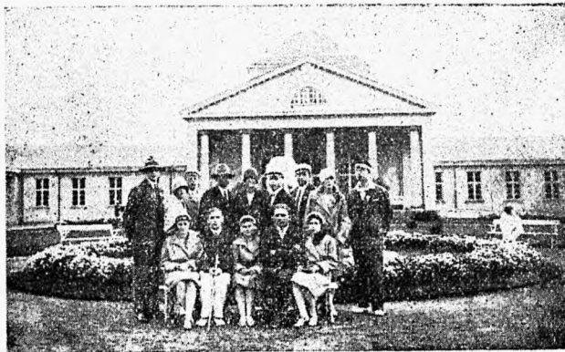
EÜKÜ II suvipäevast osavõtjaid Pärnus 1929.

eesmärgile — alkoholivabale ühiskonnale — lähemale.