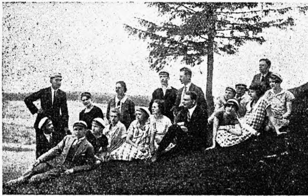
EÜKÜ I suvipäevalt Otepääl 1927.

gude, laulu, muusika ja spordi näol. Spontaanselt moodustuvad aegajalt pallimängijate grupid ja mitmesugused „klubid“, mille tegevusest ei kõnele ametlikud aruanded, ent milledel siiski ei puudu oma osa EÜKÜ üldises töös ning selle tulemusis, ja kõik need üritused tõestavad, et tahetakse ja suudetakse olla nooruslikult elurõõmus ilma alkoholiuimastuseta.