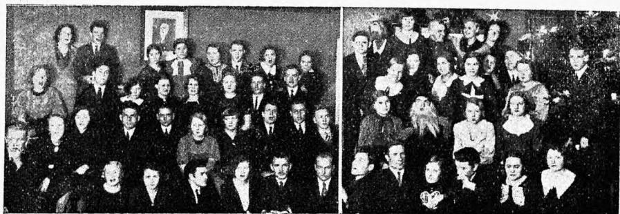
ÜKÜ 14. aastapäeva koosviibimisel, nov. 1934. ÜKÜ jõuluõhtult, det. 1934.

Et esimesel aastal eksamite peale vähe aega kulub, siis muutusin ÜKÜ igapäevaseks külaliseks, — eriti aga seepärast, et mind polnud värbitud ühtegi intiimorganisatsiooni. Veel praegugi tundub mulle ÜKÜ tähtsa vahelülina karsketele üliõpilastele ülikooli astumisel intiimorganisatsiooni valikul, võimaldades selleks aega ja luues tutvusi mitmesugustesse organisatsioonidesse kuuluvate üliõpilastega ning võimaldades nende ükülaste kaudu tutvuneda teiste org-ide sisemise eluga lähemalt. Kuid veel enam tuleb hinnata ÜKÜ väärtust vaesema ja intiimorg-est vähe huvitatud üliõpilaste suhtes, kellele ÜKÜ võib muutuda tõeliseks koduks.