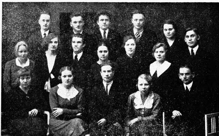
ÜKÜ liikmeid 14. aastapäeval, nov. 1934.

üldarvu suurendajana ja tööalade laiendamise ning süvendamise võimaldajana küllaltki tarviline.