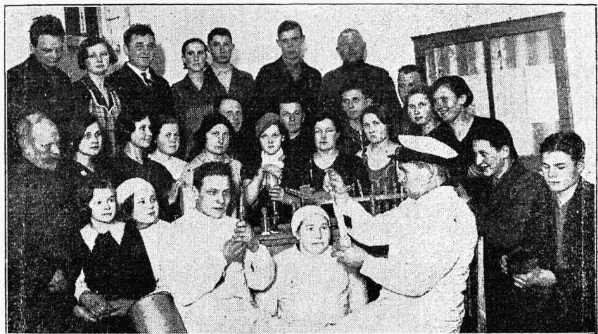
Ranna-Kadrina Maanoorte Ringi liikmed karjakasvatuse kursusel pümaproovisid sooritamas.