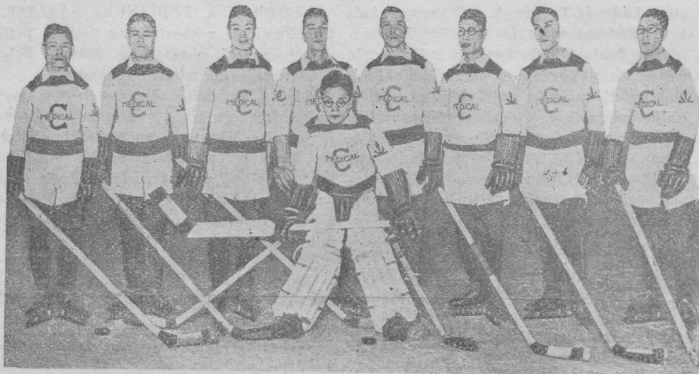
Jaapani jäähokey meeskond. Keskel nende väravavaht.

1925. a. olid võistlused Tshehho-Slovakkia Kõrges Tatrast (Strbske Plese). Tshehho-Slovakkia võitis Austriat