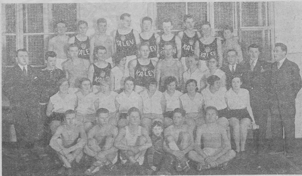
Kalevi malevkonna käsipalli meeskonna külaskäik. Narva Noorte ühing „Astra“ ja Kaitseliidu Narva malevkonna spordiklubi käsipalli naiskonnad.

Kalevi võit Narvas. „Astra“ — põhjaringkonna meister.