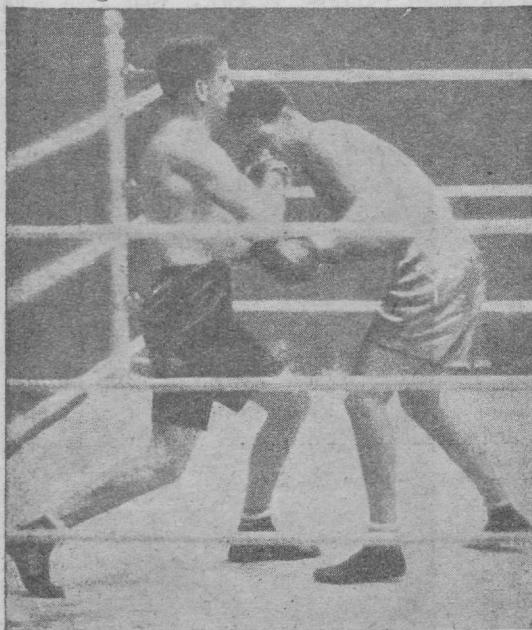
Tunney (vasakul), kes seisukorra peremees, vasardab segast Dempseyd.