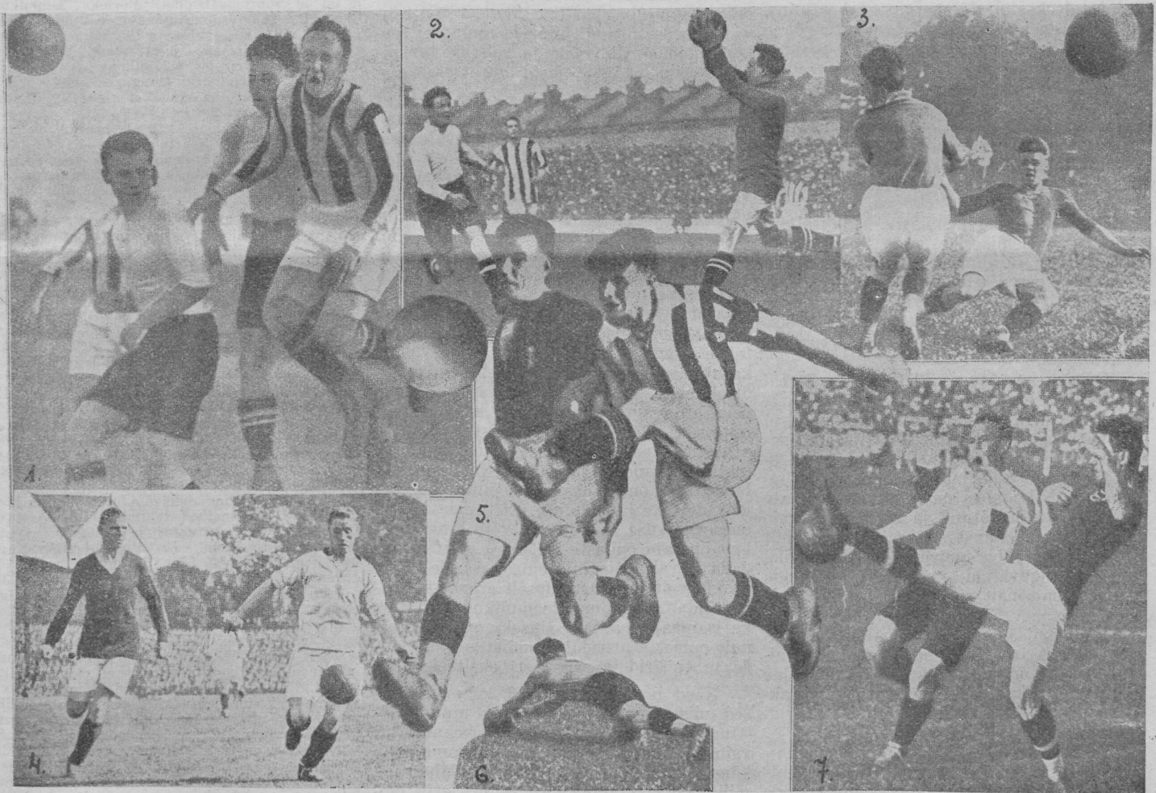
Välismaade stadionidelt. 1. Austria-Tsheho-Slovakkia maavõitlusel. Tshheh Zenšek võtab peaga palli Austria forvarditel Sindelari ja Klimal. 2. Tottenham Hotspurs lööb Westbromwich Albioni 3:0. Keskaja väravavaht Ashmore päästetöös. 3. Üllatusmatsh Viini esivõistlustel, kus Rudolfshügel lööb WAC'i 2:1. 4. Inglise suurvirtuosisid Charles Buchan (Arsenal) ja Shears (Liverpool) töös. 5. F. C. Bologna ja Torino Juventus võistlesid Itaalia ringkonna võistlustel kolm korda enne, kui võit Juventusele 2:1 langes. Schiavo ja Bigatto võistlesid palli pärast. 6. Simmeringi ja Austria väravavaht Saft heidab pallile. 7. Ungari back Fogl 2. võtab austerlaselt Ur'dililt, Rapidi tankilt, palli.

Ajal, mil meie jalgpallihooaja luigelaul õnetu välktorniirina kõlas ja kogu nahkkuulirüütlite mürarikas pere talveunne vajub, löövad vast jalgpallikired mujal maailmas õitsele, käivad eelmängud suurtele palangutele, mis päev-päevalt saabumas ja juba miljonite „jalgpallihaigete“ meeli pinevile kruvivad. Tänavu vähemalt tundub meil, et meie jalgpallihooaeg liiga vara lõppes. Võrdlemisi kaunid sügisilmad veel, stadioni muru on ideaalises korras, just kui kutsub mängule, kuid män-