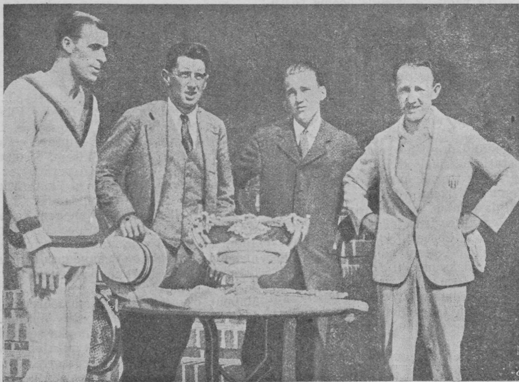
Ameerika meeskond, kes võitis tänava Davis cup'i. Seisavad vasakult: Tilden, Williams, Richards, Johnston. Laual auhind ise.

Davis'i karika ajalugu on juba 26 aastat vana. 1900. aastal tuli Mr. Dwight F. Davis (praegune Ühisriikide sõjasekretär, selajal Harvardi üliõpilane ja väljapaistev tennismängija) ideele, korraldada iga aasta ülemaailmlisi tennisvõistlusi ja annetas selleks otstarbeks väärtusliku karika, mis igavesti rändav rahvuste vahel.