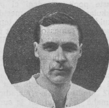
David Jack, esimese värava lööja.