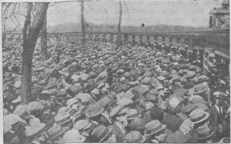
Rahvas ootab kassade juures sissepääsu