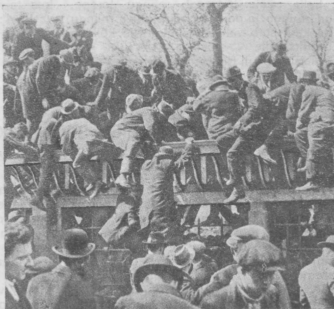
„Takistused võidetakse“, rahvas tormab üle müüri staadioni.

Pääle selle muutub mäng kõvaks ja karistuslöögid on õige sagedased. Westham surub kõvasti pääle ja püüab väravat tasuda. Bolton tõmbab oma siseajajad poolkaitsesse. Watson pääseb jälle läbi, kuid lööb Pymile sülle. Westham on nähtavas ülekaalus. Ka Richards murrab läbi, jääb aga veidi kõhklema ja Pym kargab pääle. Pall sattub ühes appitõttava Watsoniga Pymi selja taha, mida vahekohtunik off-side'iks tunnistab. Publikumis