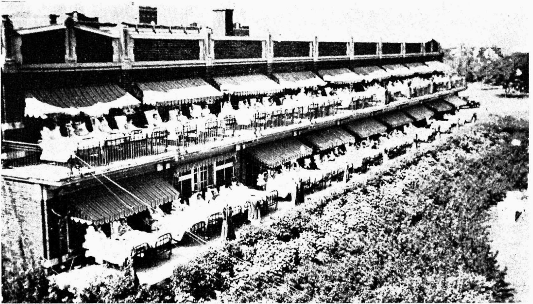
Mountain Sanatorium'i paviljon Hamiltonis, Kanadas.

Rõdul näha päikese käes lamamas haigeid.