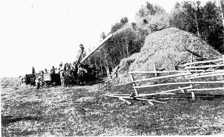
Kanada eestlase moodne viljapeksumasin.

Vili jookseb otse vankrisse, kuna põhk puistatakse eriseadeldise abil hunnikuisse.