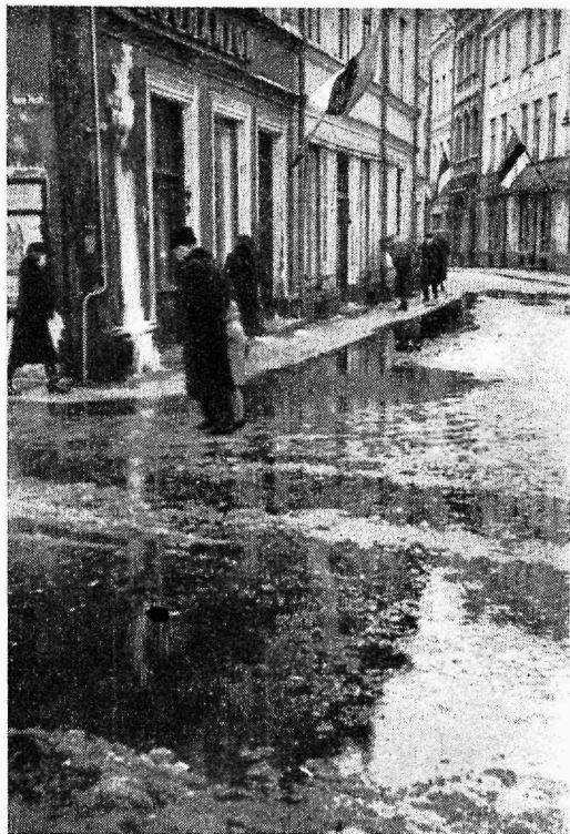
Kevad Tallinna tänavail.

Veel ei ole leidnud lõplikku lahendust ühisvastutuse tõlgitsemine, mis võlausaldajate seas on tekitanud rohkesti pahameelt. Usaldusvalitsus selles asjas talitab sääraselt, et väljamaksmisele kuulub võlg täies ulatuses siis, kui see ei ületa võlgniku varandust, millele on arvatud juurde tema aastane tulusumma. See osa, mis ulatub üle selle, ei kuulu tasumisele. Sellel seisukohal puudub aga veel Eesti valitsuse sanktsioon. Seetõttu on kreditoridele usaldusvalitsuse poolt soovitatud võlgniku aktiivset ületava osa saatuse kujunemist oodata kuni nõudmiste esitamise tähtaja lõpuni. Lähemal ajal on oodata läbirääkimiste algamist palju paksu verd tekitanud ühisvastutuse küsimuse lahendamise kohta. Mõned rahuldamata kreditorid on asja andnud kohtu lahendada. Usaldusvalitsus ei soovita aga seda teha, sest asja arutamine kanduks para-