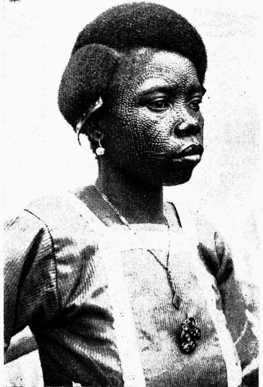
Belgia Kongo iludus kunstipäraselt tätoveeritud näoga.

kirjandus ses suhtes Leopold II vastu ja Herbert Samuel esineb isegi arupärimisega Inglise parlamendis selle üle