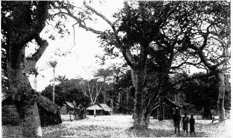
Ütid põliste puude vilus.