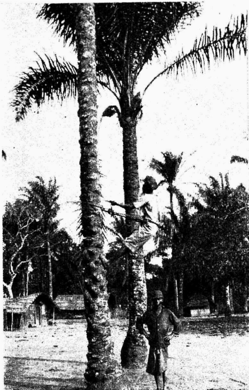
Palmimahla hankimine palmiviina valmistamiseks.

fordi. Stanley ei võtnud kohe kuninga ettepanekut vastu, vaid tahtis ennem selgusele jõuda, kuidas suhtuvad Inglismaa ja Ameerika Kongo avastamisele. Jõudnud selgusele, et inglased ja ameeriklased ei tunne huvi Kongo vastu, pöördub Stanley nüüd ise kuninga poole, kes tema pakkumise rõõmuga vastu võtab, ja astub Leopold II poolt asutatud uue seltsi „Comité d' études Haut Congo“ teenistusse. Stanley töötab välja kava ja 1879. a. sõidab ta rohkearvulise saatjaskonnaga uuesti Kongosse.