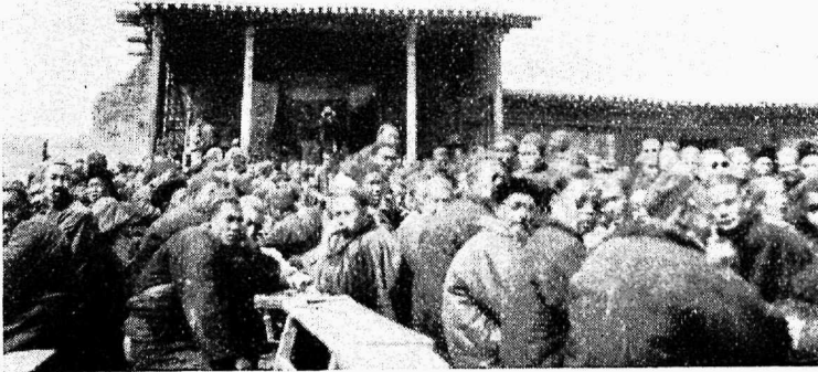
Selliseid on paljudes väike- linnades.

kavatsesin lõpetada kiirendatud korras, siiski jätkata.