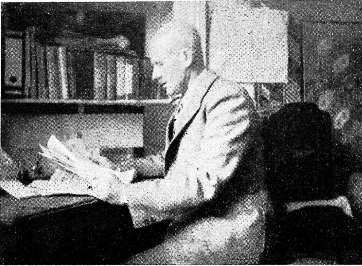
Käesoleva kirjutise autor, kelle tehtud on ka kõik kirjutuse juures toodud ülevõtted.

ma siiski kohe Ameerikasse ei purjetanud. Jäin paigale, võtsin kulla kuuest ja müüsin selle ühele jaapani juveliirile. Saadud rahast suurema osa pidin kulutama lihtsalt äraelamiseks, sest teenistust autojuhina ja ka muil aladel oli Vladivostokis väga raske saada. Hiljem siiski leidsin teenistuse ja jäin Vladivostokki umbes aastaks, kuni 1919. a. jõuludeni, millal siirdusin Mandžuuriasse, Harbiini.