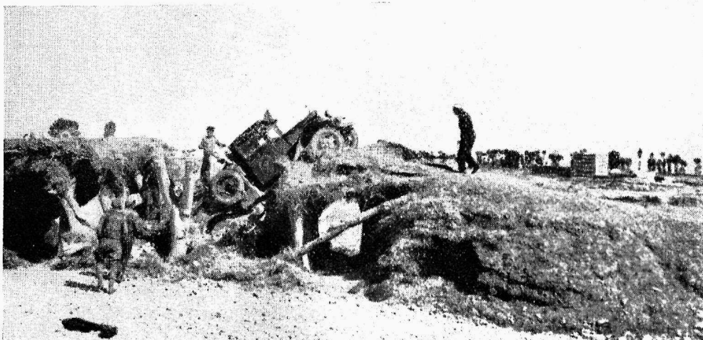
Üks reisivahejuhtumeid Kansu provintsis. Sild varises kokku veoauto all.

kuuni. Sõitsin laevaga Tientsini tagasi ja valisin elukohaks Mukdeni, mille jaapanlased olid vallutanud mõni päev varem. Töötasin seal autobusejuhina.