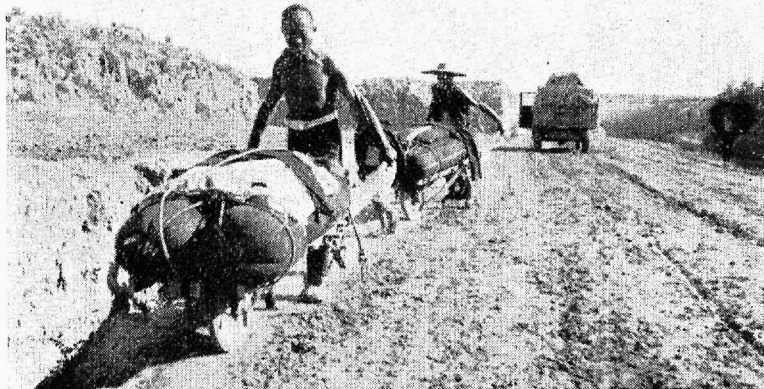
Nii liigutakse sadasid kilomeet- reid.