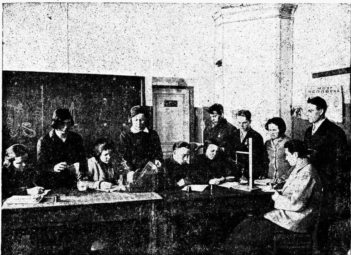
Looduseteaduse tund Eesti Pedtehnikumis.

vad koolide põhipuuduse vastu. Kuni tänase päevani KNK ei anna tehnikumile täiesti vastavaid 7-aasta kooli lõpetajaid. Sel alal tuleb KNK veel suurema energiaga edasi töötada.