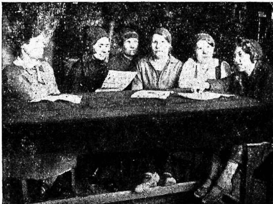
OGPU nim. tehase eestlased naislööklased.

Nüüdne OGPU nim. tehas algas oma tegevust 1914. a. Sel ajal oli töölistel selles tehases väikene kogukene. Naistöölisi ei olnud peaaegu sugugi, välja arva-