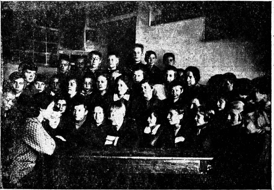
Lenini nim. kooli pioneeraktiivi koosolek.

1918. aastal pandi alus praegusele Leningradis asuvale Lenini nimelisele eesti keskkoolile ja kooli juures olevale lastemajale. Esimesed kasvandikud olid punakaardlaste ja valgest Eestist emigreerinud revolutsionääride eestlaste lapsed.